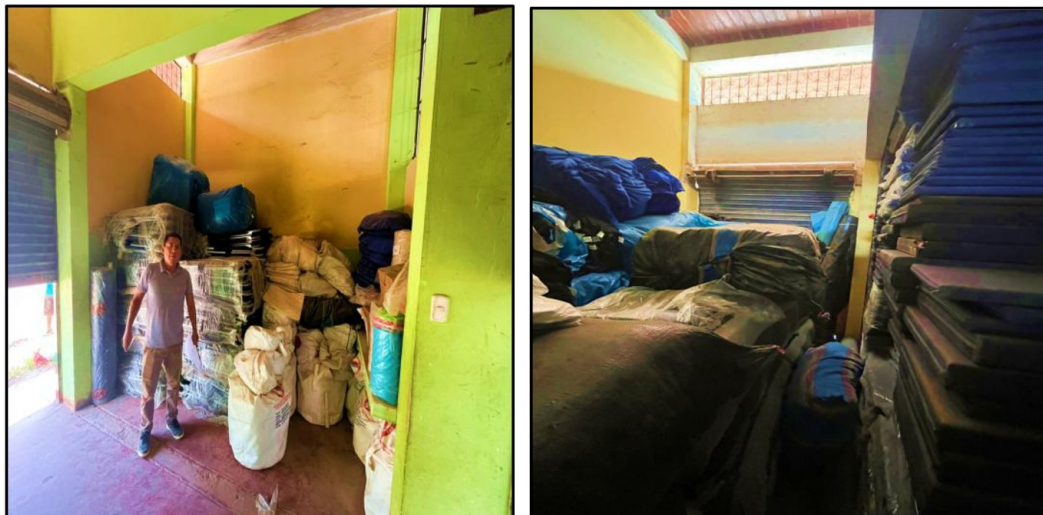
Fuente: Acta de Visita de Control n.º 01-2026-CG/OCI-MPPI de 3 de marzo de 2026.