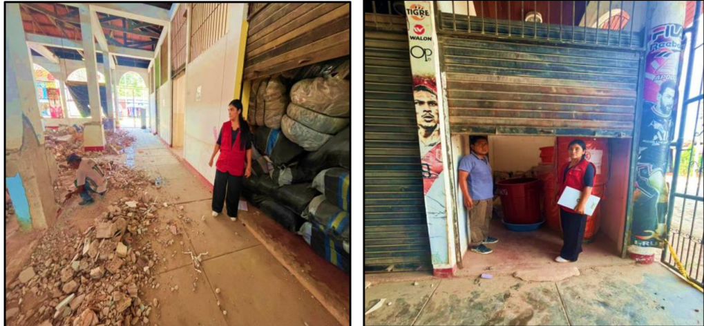
Fuente: Acta de Visita de Control n.º 01-2026-CG/OCI-MPPI de 3 de marzo de 2026.