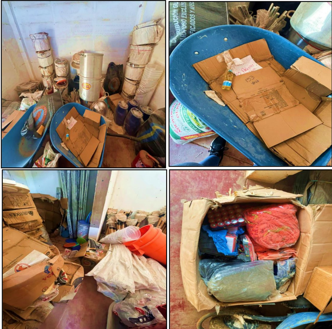
Fuente: Acta de Visita de Control n.º 01-2026-CG/OCI-MPPI de 3 de marzo de 2026.

Esta situación contraviene lo establecido en el artículo 18 del Reglamento del Decreto Legislativo n.º 1439, Decreto Legislativo del Sistema Nacional de Abastecimiento, el cual señala lo siguiente: