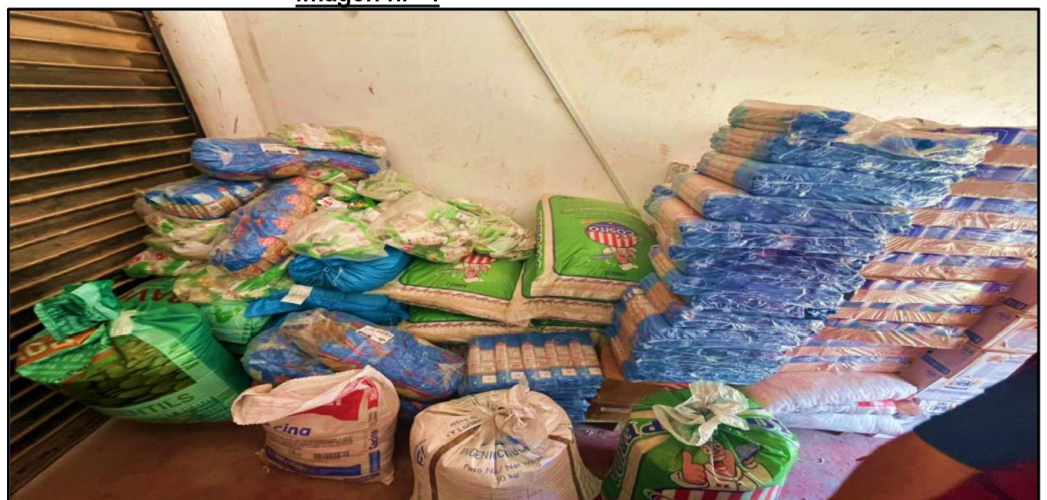
Fuente: Acta de Visita de Control n.º 01-2026-CG/OCI-MPPI de 3 de marzo de 2026.