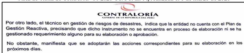
Imagen n.º 14 Acta de Visita de Control N.º 01-2026-CG/OCI-MPPI, realizada el 3 de marzo de 2026

En ese sentido, el hecho de que la entidad no cuente con instrumentos de planificación orientados a la gestión reactiva ante emergencias o desastres limita la adecuada organización, coordinación y ejecución de acciones destinadas a la atención oportuna de la población afectada.