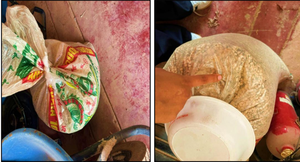
Fuente: Acta de Visita de Control n.º 01-2026-CG/OCI-MPPI de 3 de marzo de 2026.

Asimismo, existen bienes alimenticios, como leche evaporada, cuya fecha de vencimiento es el 25 de abril de 2026, encontrándose próximos a caducar, lo que evidencia la necesidad de adoptar acciones oportunas para su distribución o reposición.