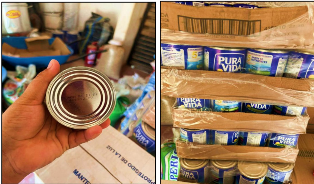
Fuente: Acta de Visita de Control n.º 01-2026-CG/OCI-MPPI de 3 de marzo de 2026.