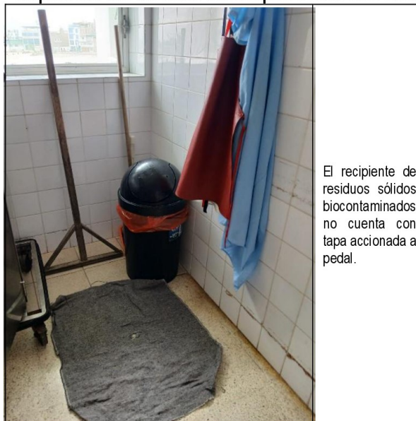
Imagen fotográfica n.º 6 Repuesto del Servicio de Hospitalización de Ginecología