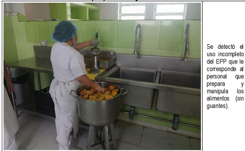
Imagen fotográfica n.º 3 Área de preparación y cocción de alimentos

Se detectó el uso incompleto del EPP que le corresponde al personal que prepara y manipula los alimentos (sin guantes).