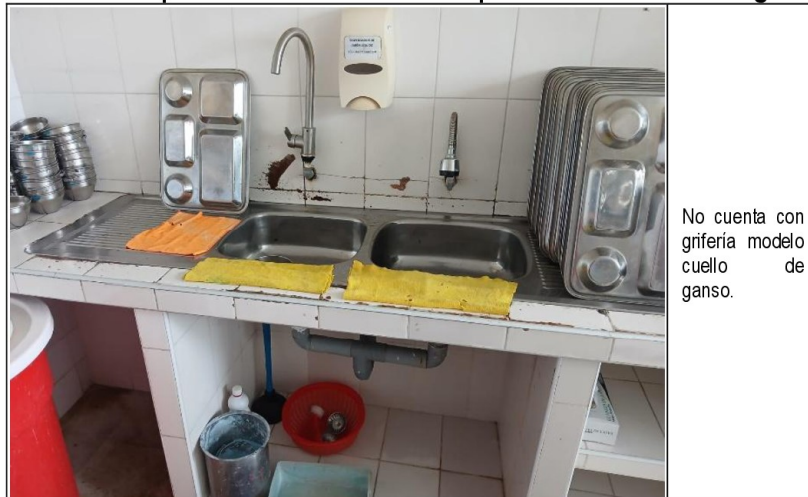
Imagen fotográfica n.º 5 Repuesto del Servicio de Hospitalización de Ginecología