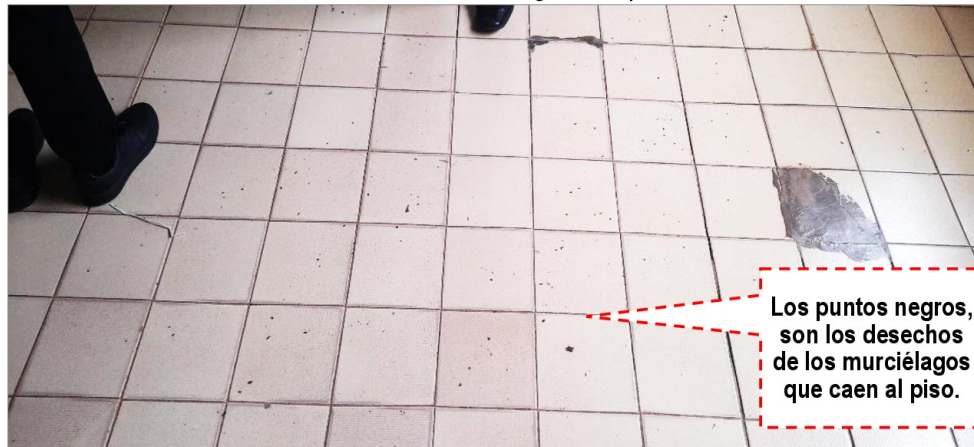
Imagen N° 13 Desechos de murciélagos en el piso

Los puntos negros, son los desechos de los murciélagos que caen al piso.