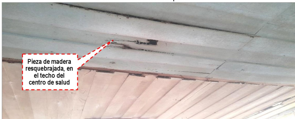
Imagen N° 11 Falso cielo de madera desprendido