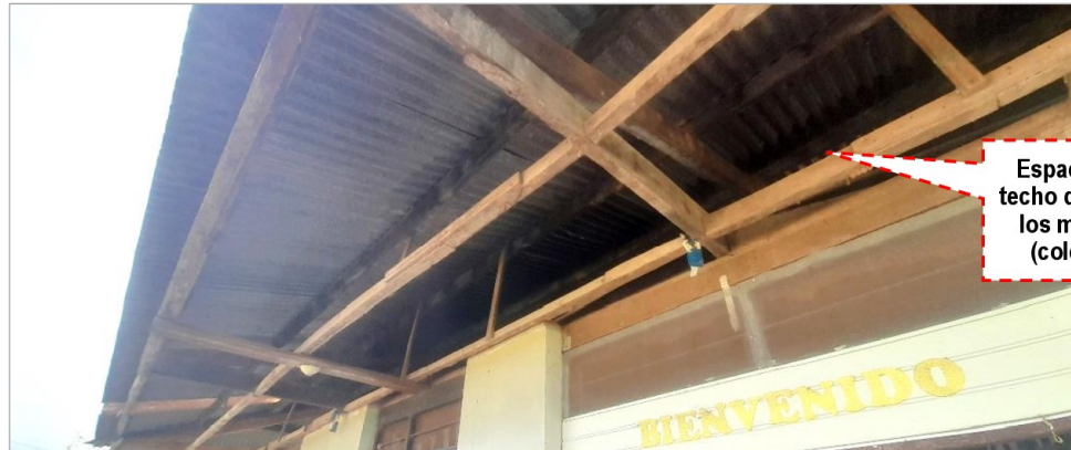
Imagen N° 12 Cobertura del Puesto de Salud

Espacio libre del techo donde anidan los murciélagos (color blanco)