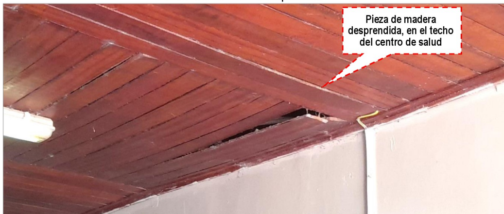
Imagen N° 10 Falso cielo de madera desprendido