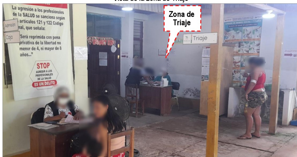
Vista de la zona de Triage