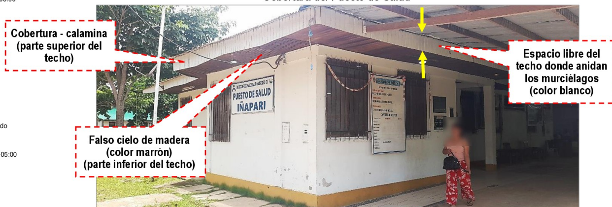
Cobertura del Puesto de Salud