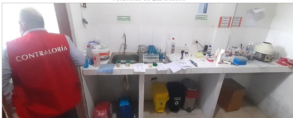
Imagen N° 9 Ambiente de Laboratorio