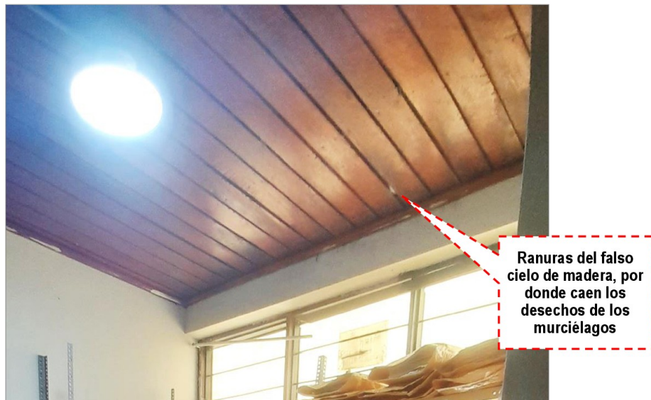
Imagen N° 7 Falso cielo de madera