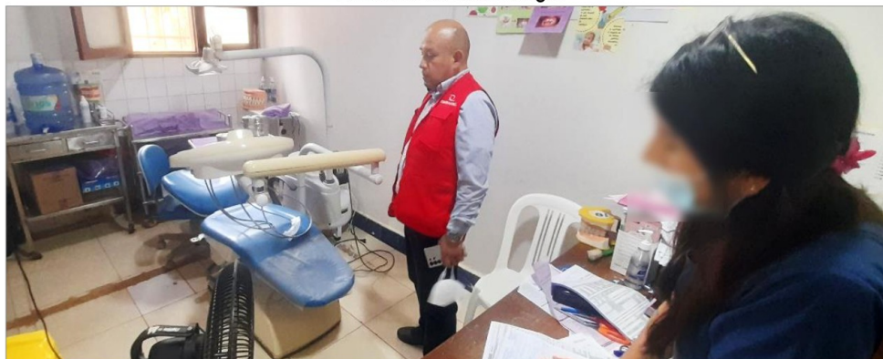
Imagen N° 10 Ambiente de Odontología

Fuente: Visita de Control Puesto de Salud Iñapari, el 15 de diciembre de 2025. Elaborado por: Comisión a cargo de la Visita de Control.