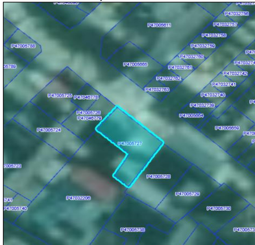
Imagen n.º 1 Bien objeto de donación a UNIADI