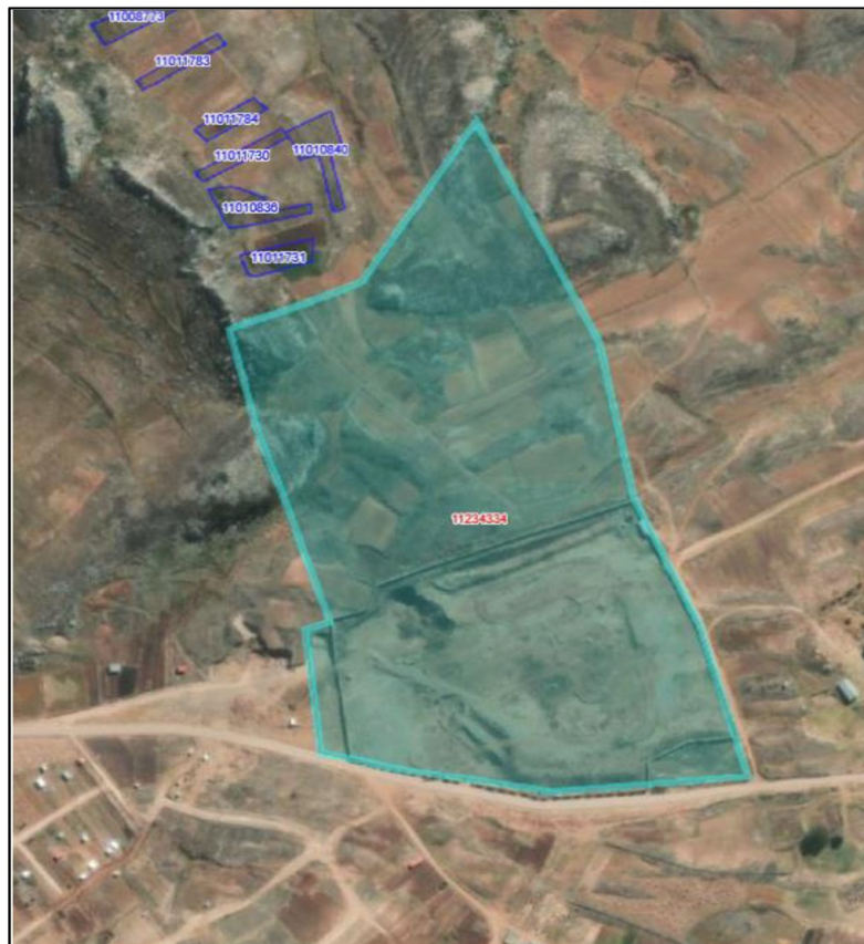
Imagen n.º 2 Inmueble no predial objeto de donación a UNIADI