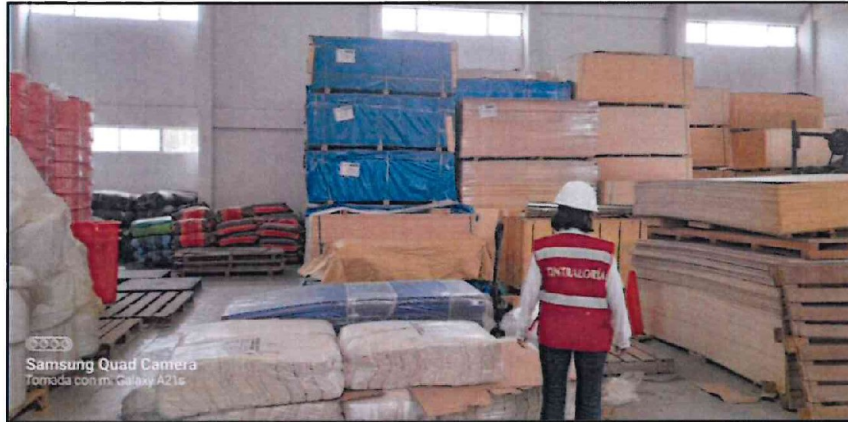
Imagen n.º 6 Material almacenado sin respetar las áreas de circulación