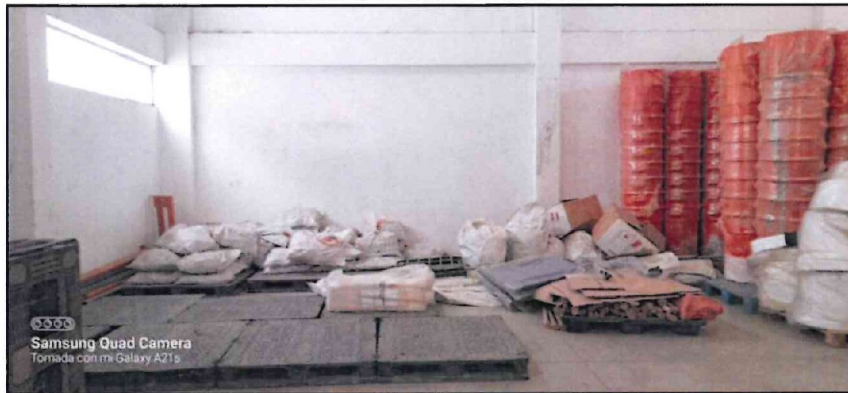
Imagen n.º 7 Material almacenado en desorden