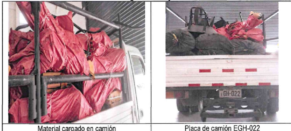
Imágenes n.ºs 8 y 9