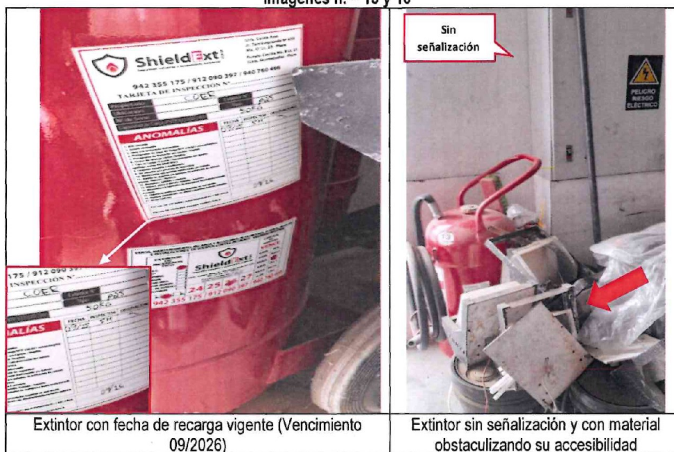
Imágenes n.ºs 15 y 16