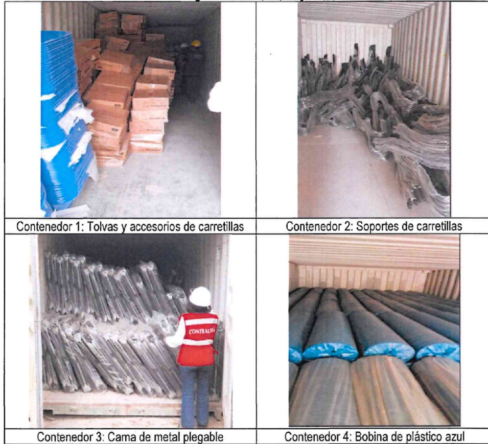
Imágenes n.ºs 10, 11, 12 y 13