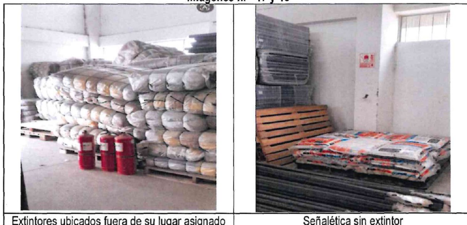
Imágenes n.ºs 17 y 18