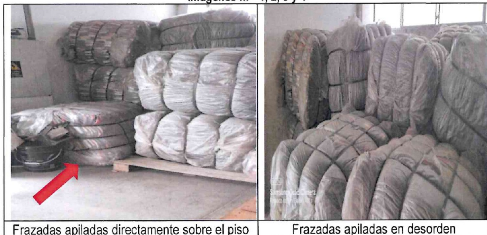
Frazadas apiladas directamente sobre el piso