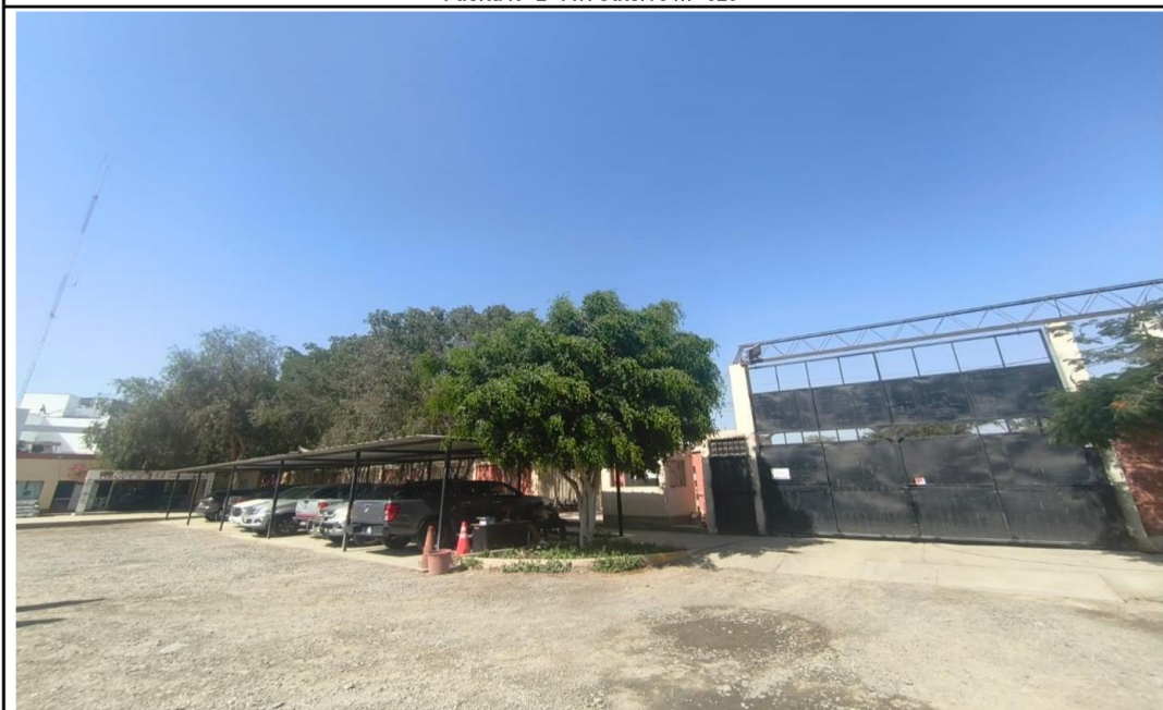
Puerta N° 3 Av- Túpac Amaru