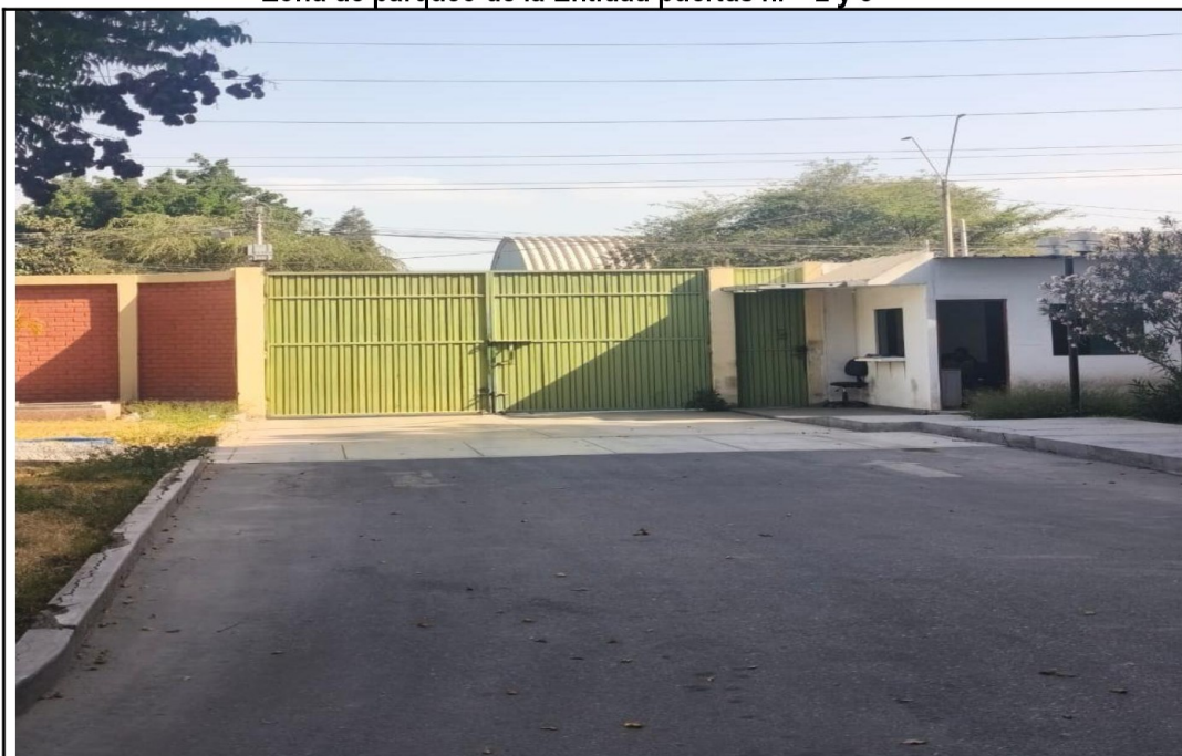
Puerta N° 2 Av. Cutervo n.º 920