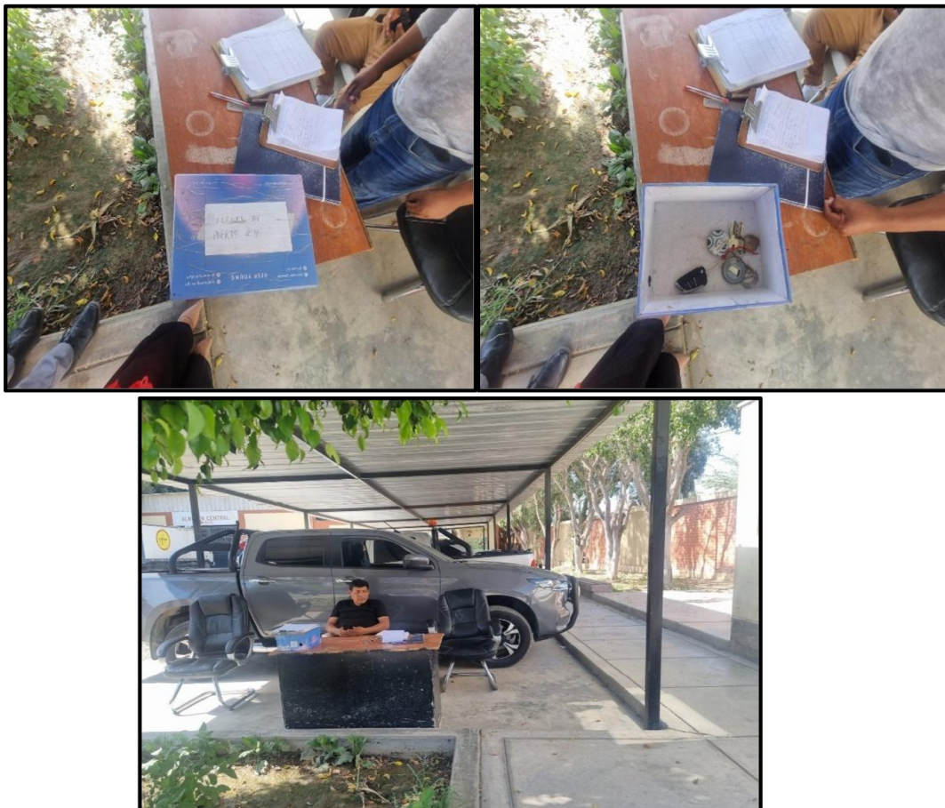
Imagen n.º 4 Custodia de las llaves de las unidades vehiculares operativas de la Entidad