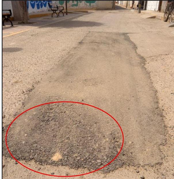
Imagen n.º 2 Presencia de segregación y superficie irregular en la reposición de carpeta asfáltica de la servidumbre de paso de AA.HH Los Espigos