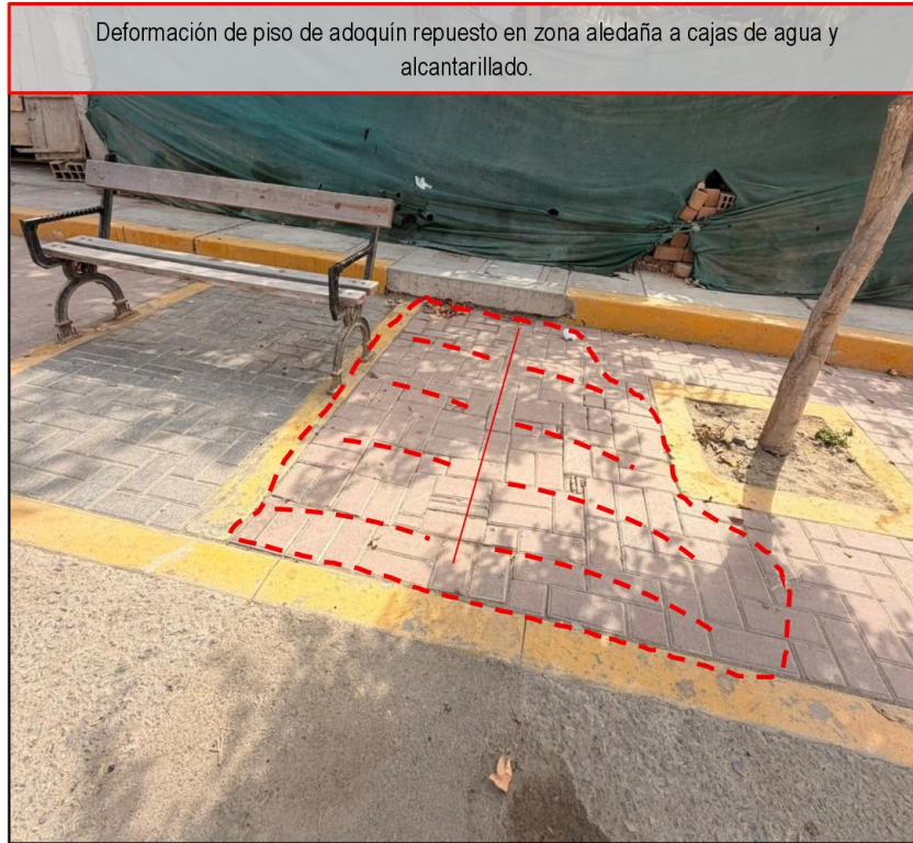
Deformación de piso de adoquín repuesto en zona aledaña a cajas de agua y alcantarillado.