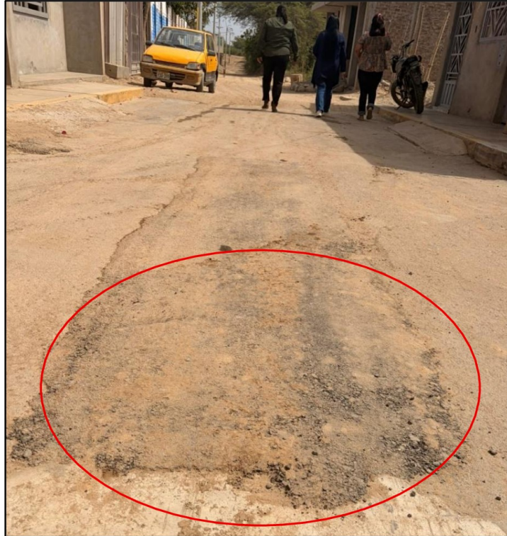
Fuente: Acta de Visita de Inspección n.º002-2026/OCI-MPI-SVC-2693110 de 29 de abril de 2026 Elaborado Por: Comisión de Visita de Control.

Según se puede apreciar en las imágenes precedentes, la reposición de carpeta asfáltica presenta segregaciones, una superficie irregular y desnivel entre el pavimento nuevo y pavimento antiguo