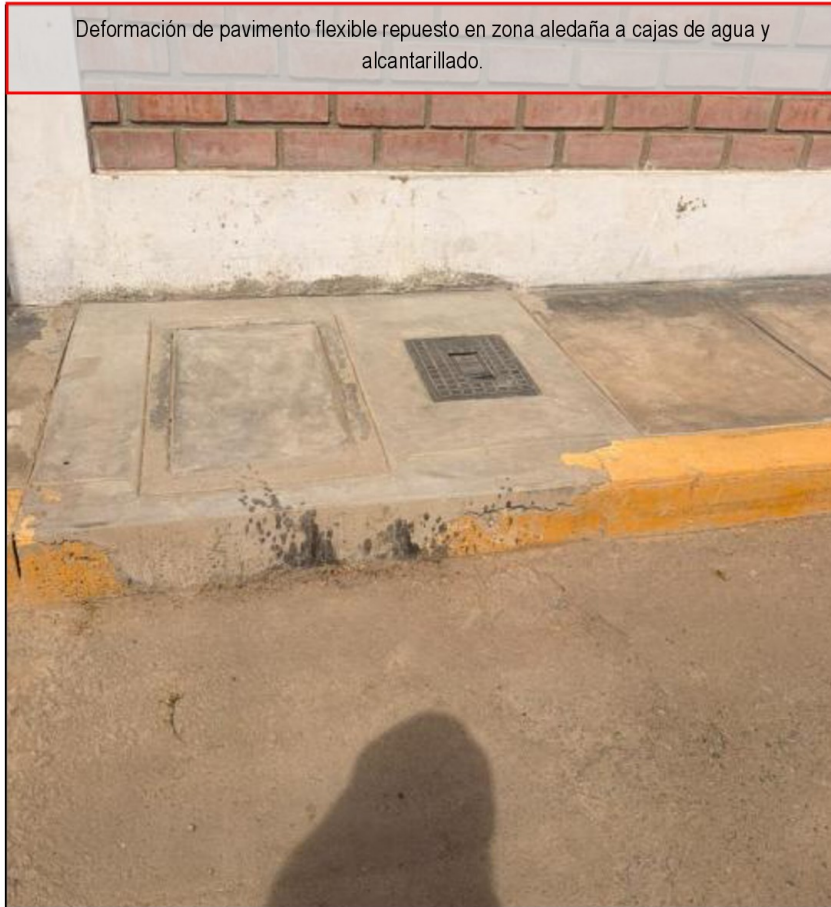
Deformación de pavimento flexible repuesto en zona aledaña a cajas de agua y alcantarillado.