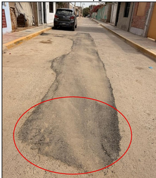
Imagen n.º 3 Presencia de segregación y superficie irregular en la capa asfáltica de la servidumbre de paso de AA.HH Los Espigos