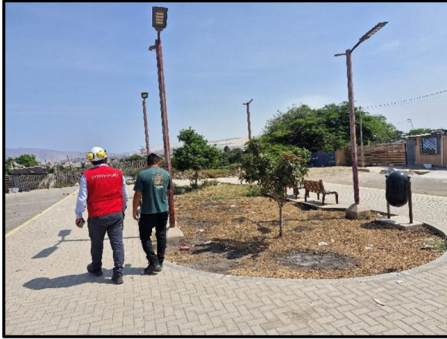
Grass seco de jardín de la Calle S/N -4