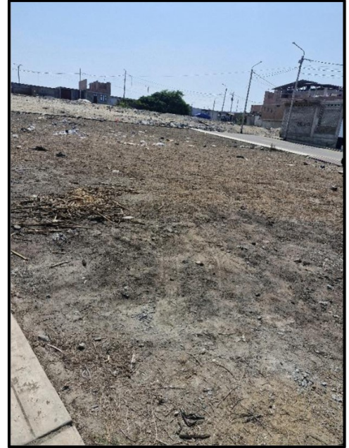
Grass seco de la berma central de la Calle S/N -14