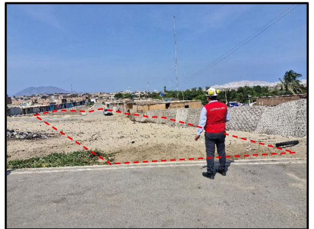
Calle S/N-14 (Progresiva 0+120 a 0+162) no se han ejecutado trabajos para construcción de pavimento.