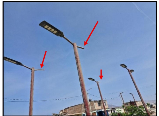
Postes de alumbrado público despintados y con ausencia de luminarias