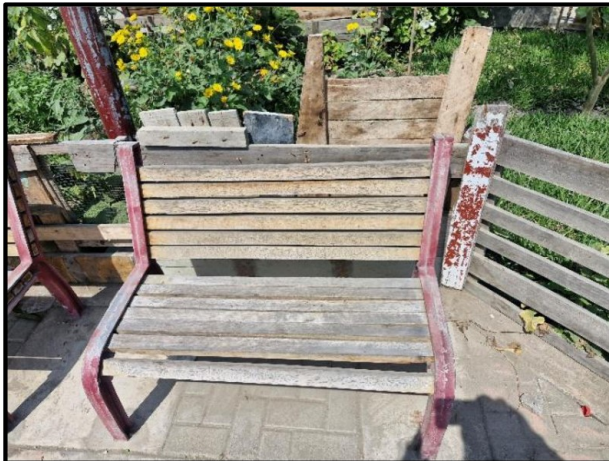
Bancas de madera deterioradas