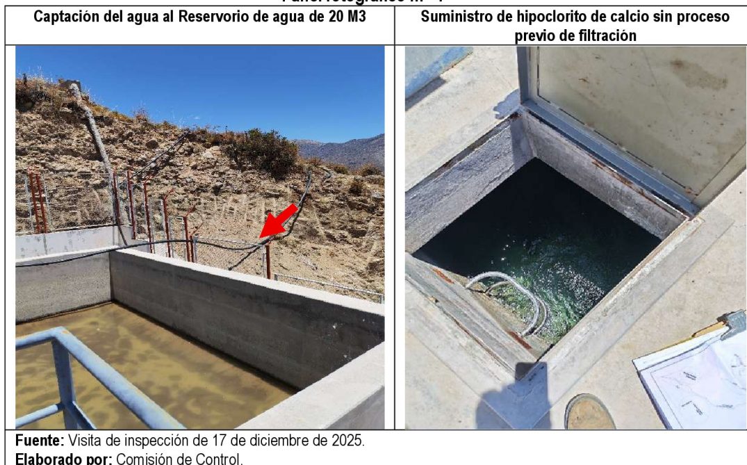
Panel fotográfico n.º 4

En el marco de lo expuesto, la PTAP capta el agua, la almacena en el reservorio de 20 m3 y suministra hipoclorito de calcio sin realizar el proceso de filtración, advirtiendo que no se realiza la remoción de microorganismos, incumpliendo lo establecido en el numeral 5.6 Filtros Lentos de Arena OS.020 Tratamiento de Agua para Consumo Humano.