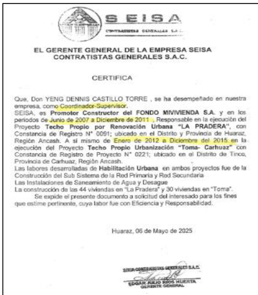
IMAGEN N° 2 CERTIFICADO DE TRABAJO QUE ACREDITÓ EXPERIENCIA ESPECÍFICA DEL GERENTE DESIGNADO