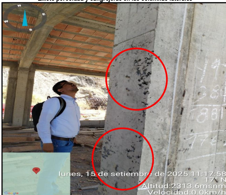
Imagen n.º 10 Existe porosidad y cangrejeras en las columnas laterales