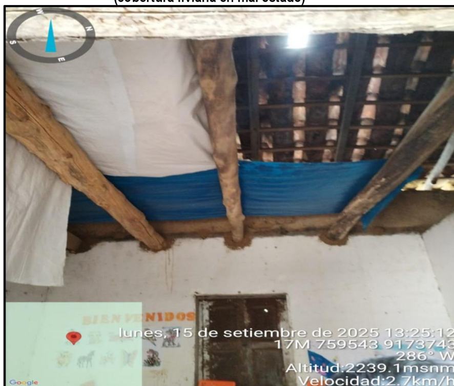
Imagen n.º 30 Ambientes destinados a las clases de los alumnos de nivel inicial (cobertura liviana en mal estado)