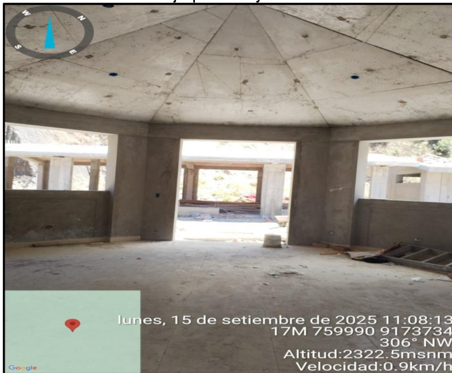
Imagen n.º 5 Trabajos paralizados y atrasados