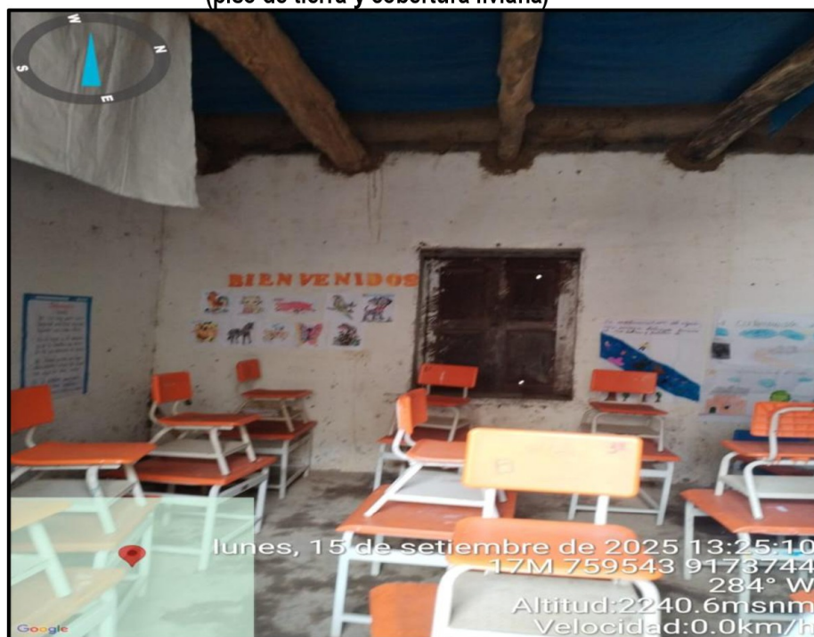
Imagen n.º 29 Ambientes destinados a las clases de los alumnos de nivel inicial (piso de tierra y cobertura liviana)