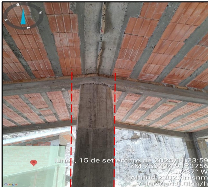
Imagen n.º 9 No existe verticalidad de la columna central.

Fuente: Acta de visita n.º 001-2025-OCI/3614-SVC-I.E SAN FELIPE de 15 de setiembre de 2025.