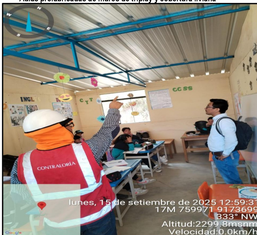
Imagen n.º 28 Aulas prefabricadas de muros de triplay y cobertura liviana