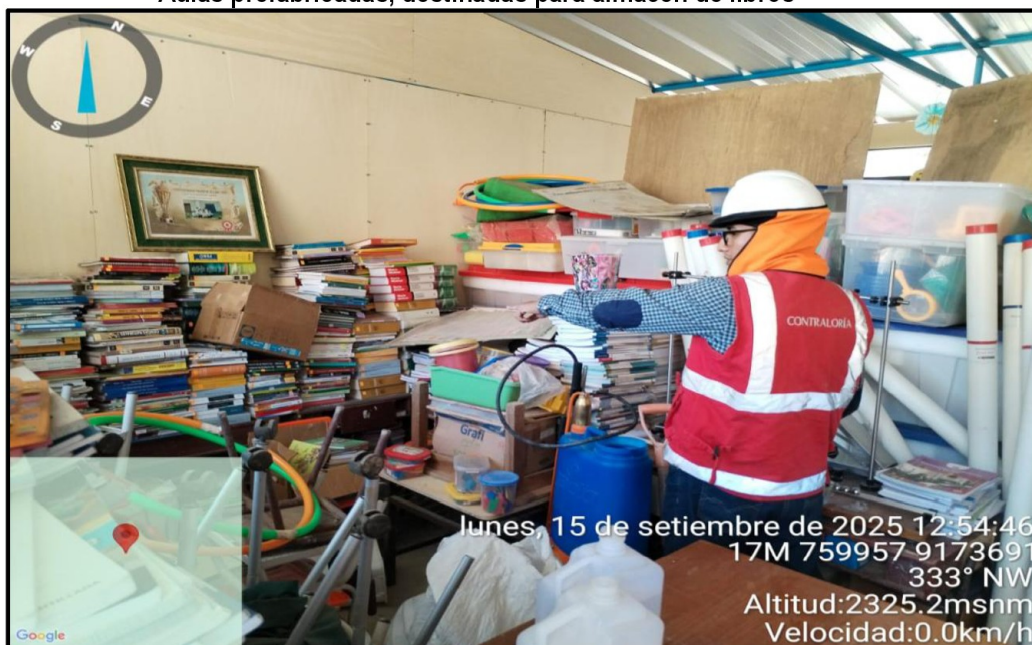
Imagen n.º 27 Aulas prefabricadas, destinadas para almacén de libros

Fuente: Acta de visita n.º 001-2025-OCI/3614-SVC-I.E SAN FELIPE de 15 de setiembre de 2025.