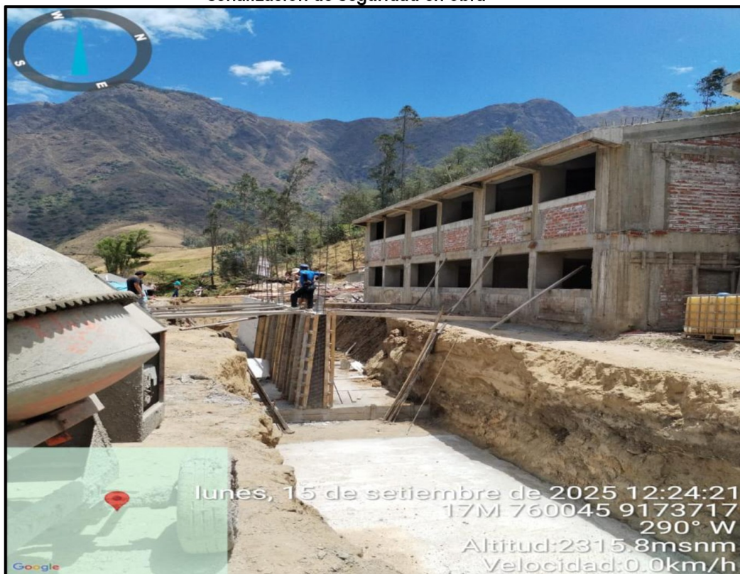
Imagen n.º 25 Trabajos incompletos en las partidas de concreto armado del muro de contención, sin señalización de seguridad en obra