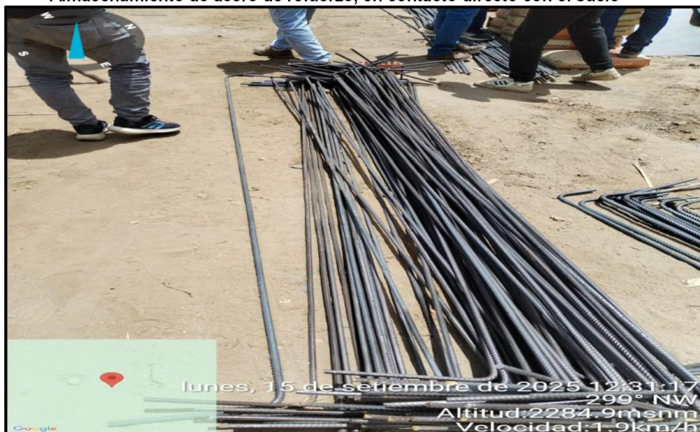
Imagen n.º 26 Almacenamiento de acero de refuerzo, en contacto directo con el suelo