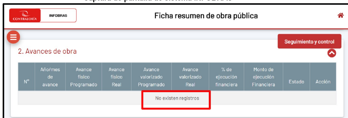
Imagen n.° 31 Captura de pantalla de sistema INFOBRAS