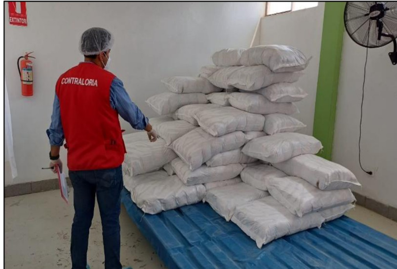
Imagen n.º 6 Insumos por entregar a 18 comités (1240 Kg)