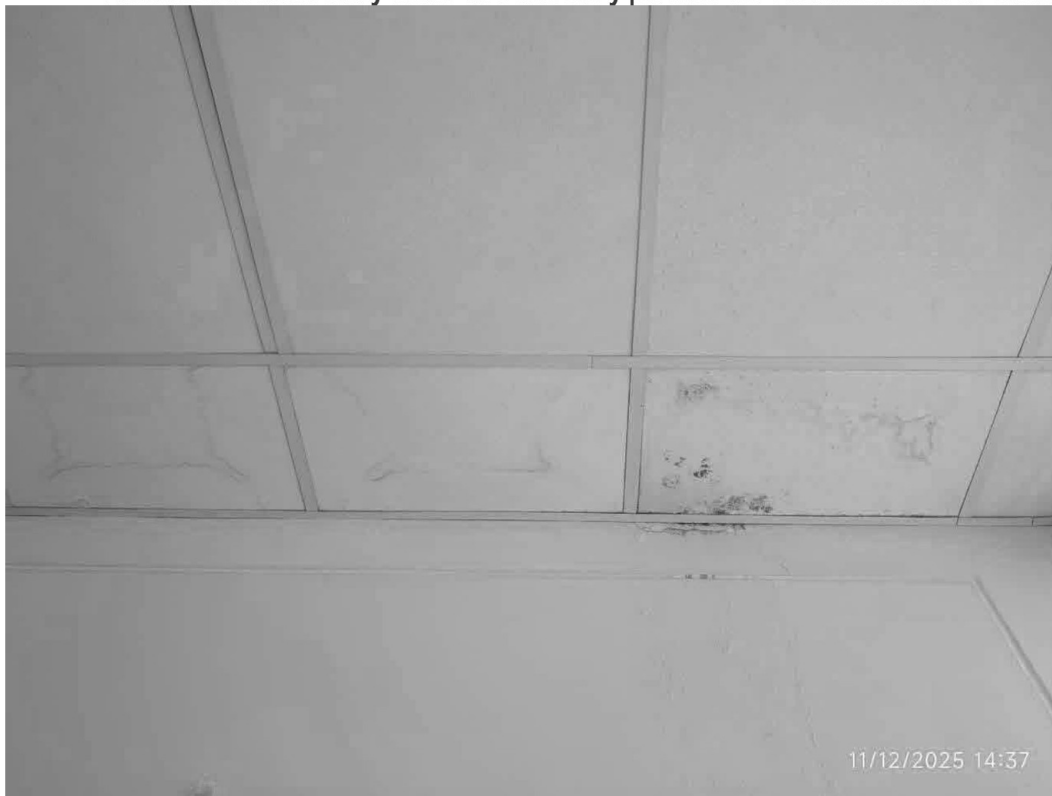
Imagen n.ºs 7, 8 y 9 Presencia de humedad y moho en baldosas y paredes del establecimiento de salud.