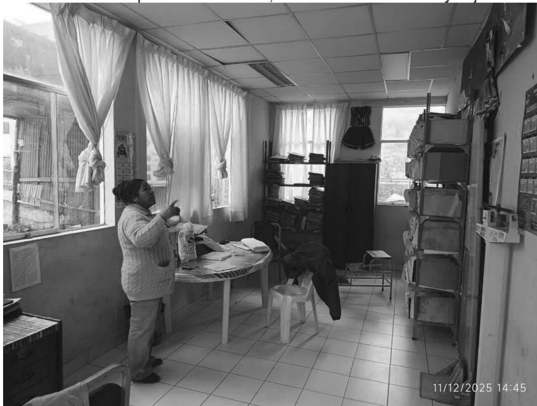
Imagen n.º 2 Ambiente compartido entre admisión, archivo de historias clínicas y triaje