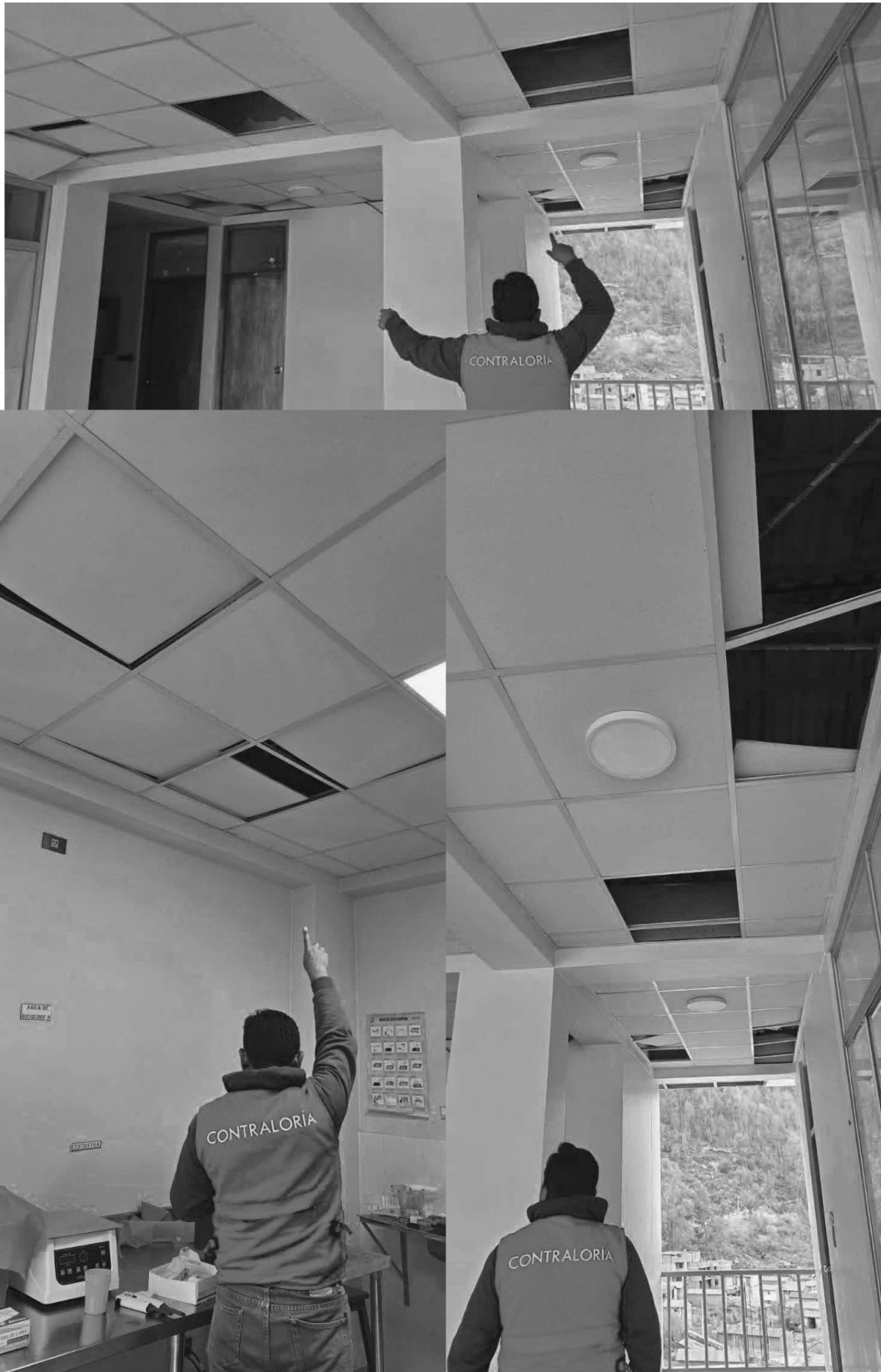
Imagen n.ºs 10, 11 y 12 Cielo raso sin baldosas o baldosas movidas.