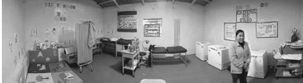
Imagen n.º 9 Ambiente 2, compartido por cadena de frío, sala de inmunizaciones y consultorio de crecimiento y desarrollo