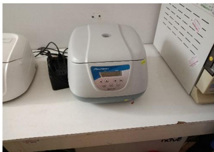
Centrifuga para tubos marca Next Spin lugar laboratorio sin código patrimonial