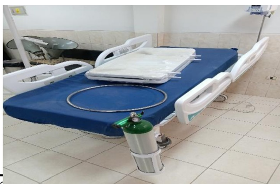
Cama eléctrica hospitalaria marca Metax lugar auditórium sin uso