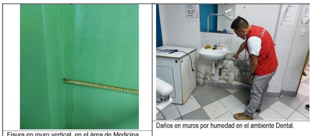
Fisura en muro vertical, en el área de Medicina.

En el área de Medicina se observó fisura en muro vertical y en el área de Dental se verificó daños en el muro por humedad, conforme se muestra en las imágenes siguiente: