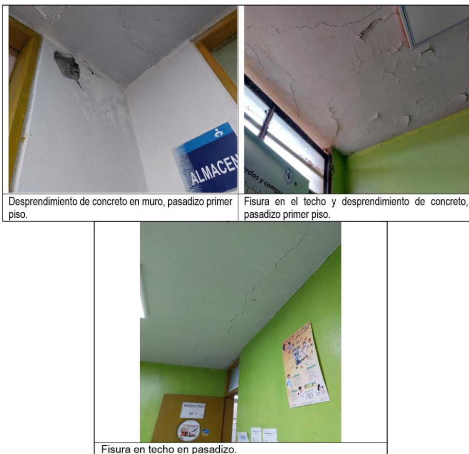
Desprendimiento de concreto en muro, pasadizo primer piso.