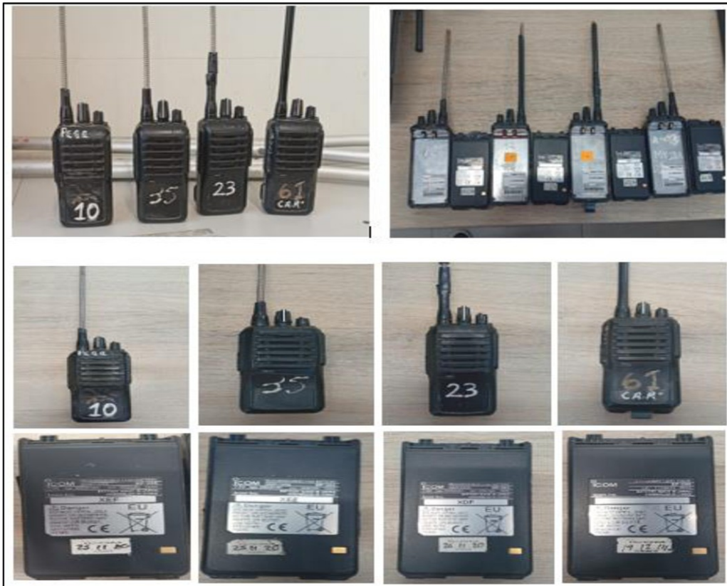
Fotografías de radios portátiles inoperativos