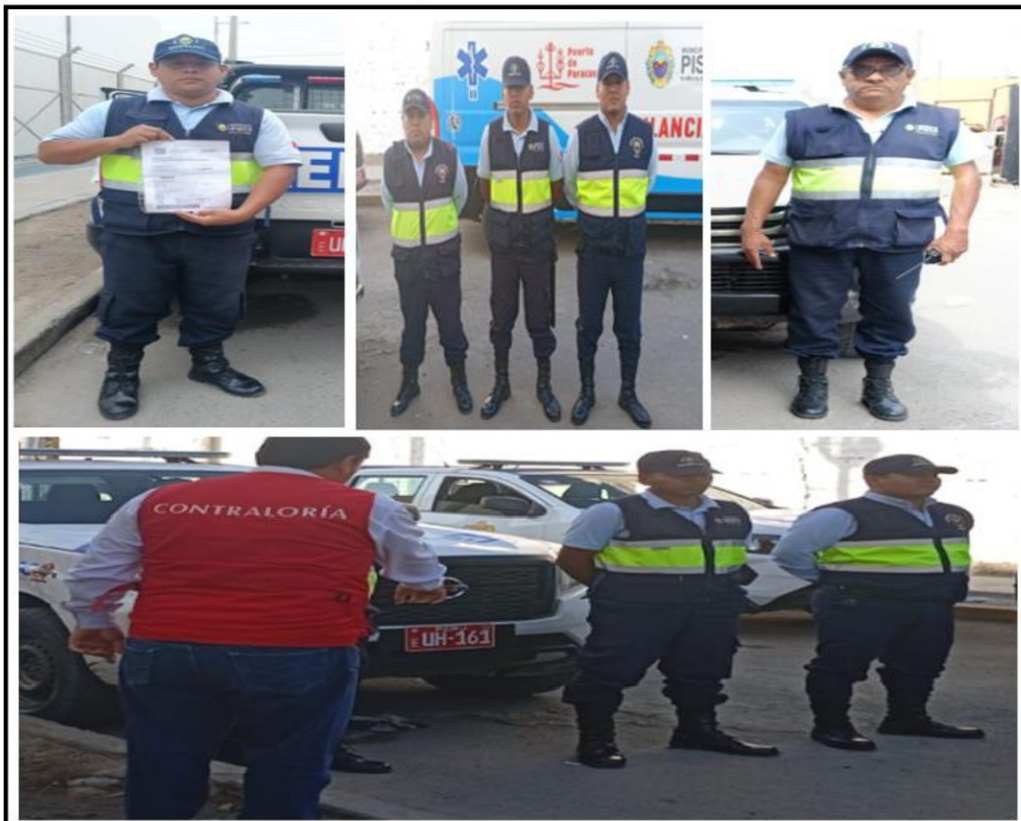
Imagen N° 16 Personal de serenazgo de la Municipalidad Provincial de Pisco

Fuente: Operativo de Control “Seguridad ciudadana en los gobiernos locales” realizado en la Municipalidad Provincial de Pisco.