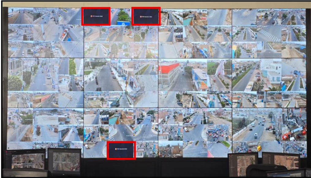
Imagen N° 4 En la pantalla de monitoreo se visualizan tres (3) cámaras de videovigilancia inoperativas