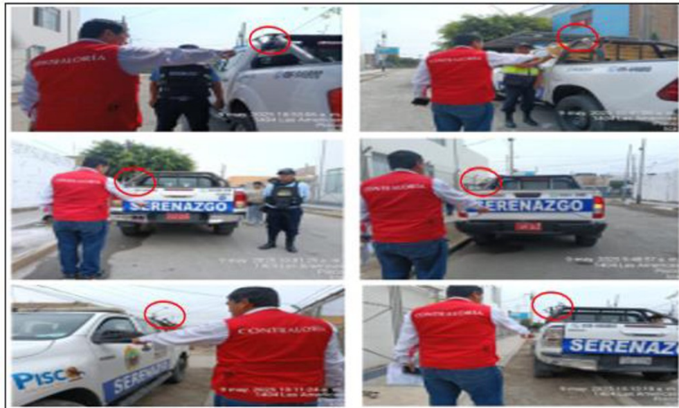
Fotografía de las camionetas de seguridad ciudadana que no cuentan con extintores