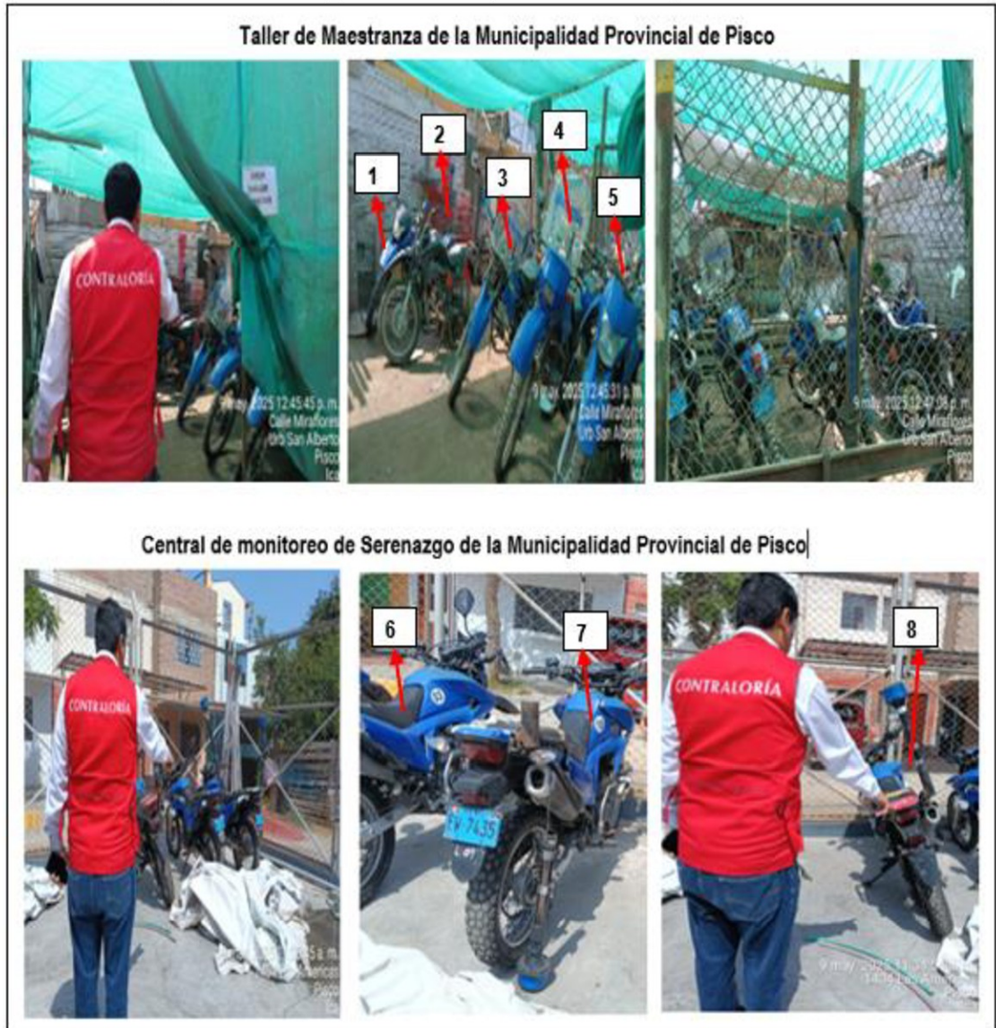
Fuente: Operativo de Control "Seguridad ciudadana en los gobiernos locales" realizado en la Municipalidad Provincial de Pisco. Elaborado por: Comisión de Visita de Control

Cabe precisar que, cinco (5) motocicletas inoperativas se encuentran en el taller de maestranza y tres (3) motocicletas inoperativas se ubican afuera de la central de monitoreo de la Municipalidad Provincial de Pisco, a la intemperie, sin ningún tipo de protección que disminuya su deterioro. Asimismo, las dos (2) camionetas inoperativas se encuentran en el taller de maestranza tal como se observa en la imagen siguiente: