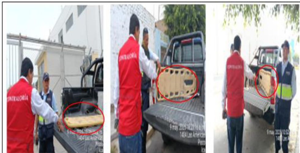
Fotografía de las camionetas que no cuentan con las correas o fajas de seguridad para las camillas