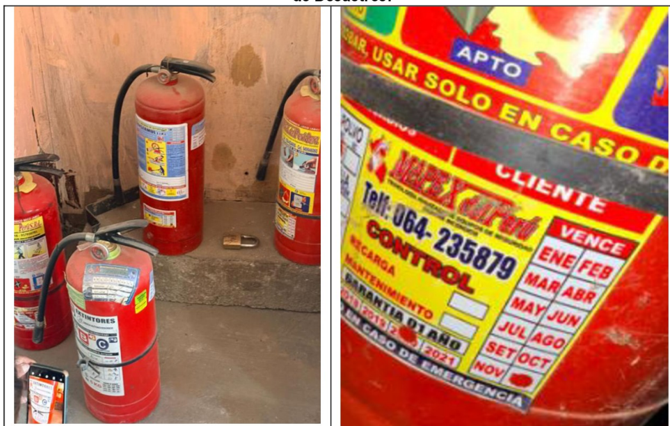
Imagen n.° 15 y 16

Extintores vencidos ubicados en el almacén del Área de Defensa Civil y Gestión de Riesgos de Desastres.