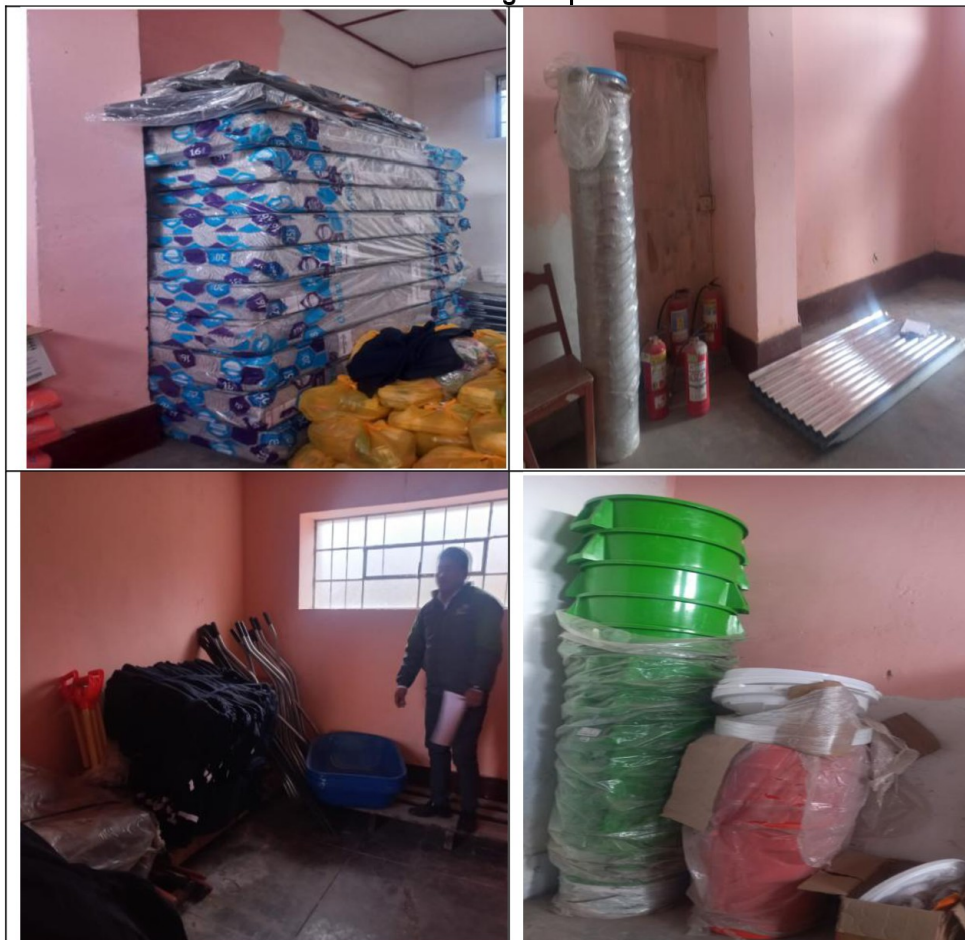
Imágenes fotográficas n.º 5, 6, 7 y 8 Bienes almacenados sin ningún tipo de control visible

Tal como se muestran en las imágenes los bienes que se encuentran en custodia en el almacén del Área de Defensa Civil y Gestión de Recursos de Desastres de la Entidad no cuentan con ningún control visible y/o KARDEX que permita el registro de entrada y/o salida de los bienes.