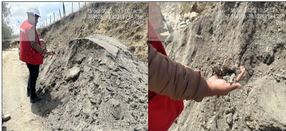
Fotografías n.º 9, n.º 10, n.º 11 y n.º 12: En el puente Lanchicot, se puede observar que el material grueso tales como la gravilla de ½" y la arena gruesa n.º 04 se encuentran con impurezas con material de tierra de chacra y además se puede apreciar que el material de gravilla de ½" este mezclado con confitillo y piedra de canto rodado.

Cabe señalar que, a la fecha de la inspección física, la obra se encontraba "suspendida", no obstante, según las fotografías N.ºs 3,4,5,6,7 y 8 de la situación adversa N.º 01, se puede advertir que, la Contratista habría realizado trabajos de vaciado de concreto en la partida 03.02.02.01 Concreto f'c=210 \text{ kg/cm}^2 + 40\% - piedra grande de emboquillado del adicional n.º 01, con agregados que no cumple las especificaciones técnicas del expediente técnico y tampoco con el diseño de mezcla 7 presentado por el Contratista, el cual indica que el agregado grueso debe ser la piedra chancada que se obtiene por trituración artificial de otras piedras grandes y la condición de este material debe ser limpio y resistente, tal como se detalla a continuación: