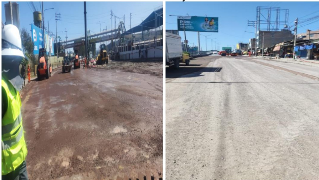
IMÁGENES N°s 1 y 2