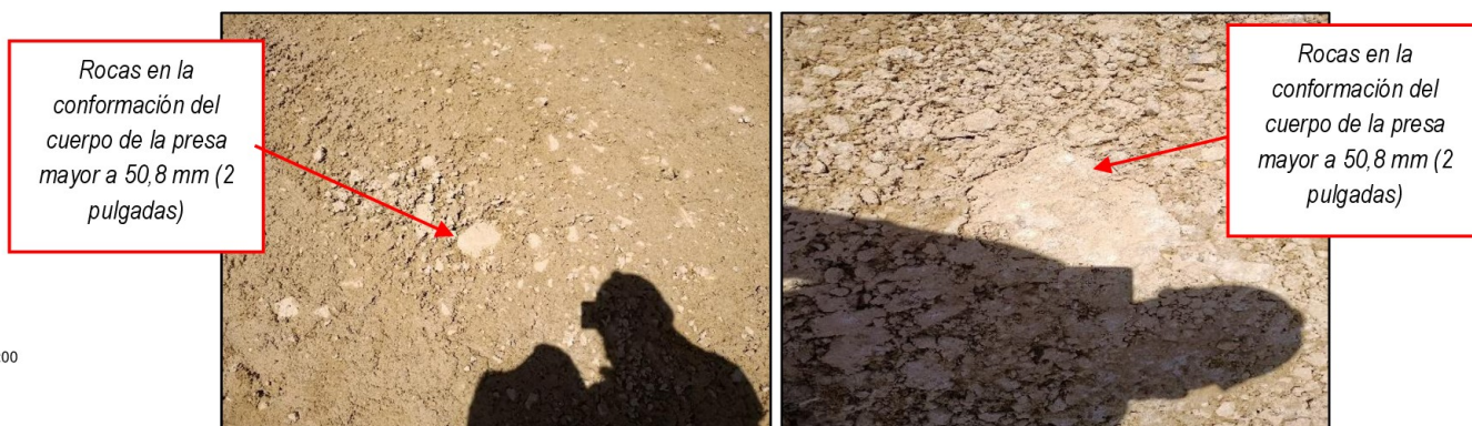
FOTOGRAFÍAS N°s 1 y 2 GRAVAS MAYORES A 2 PULGADAS ENCONTRADAS EN LA CUERPO DE LA PRESA