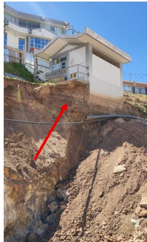
Imagen n.º 16: Visita de inspección a la zona de la estructura de la Sub estación eléctrica por la Comisión de Control y los responsables de la ejecución de obra.

Imagen n.º 17: Inspección de la infraestructura Sub estación eléctrica que presenta riesgo de colapso por el desmoronamiento del terreno de fundación a causa de la excavación con maquinaria pesada y las precipitaciones pluviales.