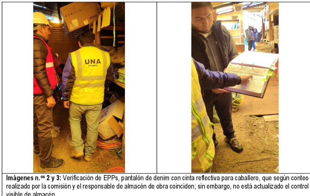
Imágenes n.°s 2 y 3 Verificación del Almacén de obra n.° 01

Imágenes n.°s 2 y 3: Verificación de EPPs, pantalón de denim con cinta reflectiva para caballero, que según conteo realizado por la comisión y el responsable de almacén de obra coinciden; sin embargo, no está actualizado el control visible de almacén.