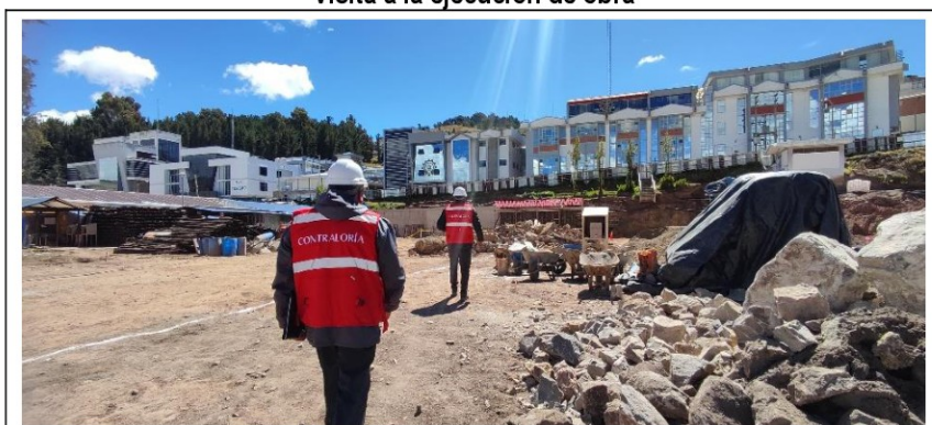
Imágenes n.º 13 Visita a la ejecución de obra

Área del bloque B y bloque C, en donde está proyectado la construcción del auditorio, taller de mantenimiento, cocina, cafetería y el centro de estudiantes, que a la fecha de la visita no se inició con la excavación para la cimentación.