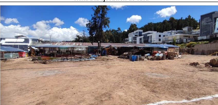
Imágenes n.º 14 Visita a la ejecución de obra

Área del bloque D y bloque F, en donde está proyectado la construcción de las aulas académicas y el Hall principal de circulación, que a la fecha de la visita no se inició con la excavación para la cimentación.