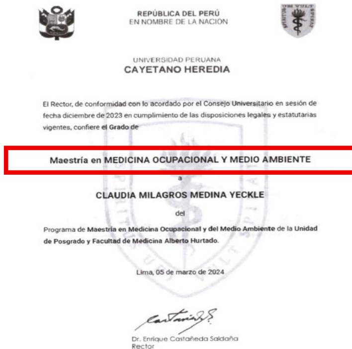
Imagen n.º 1: Certificado de maestría presentado por el adjudicatario de la buena pro