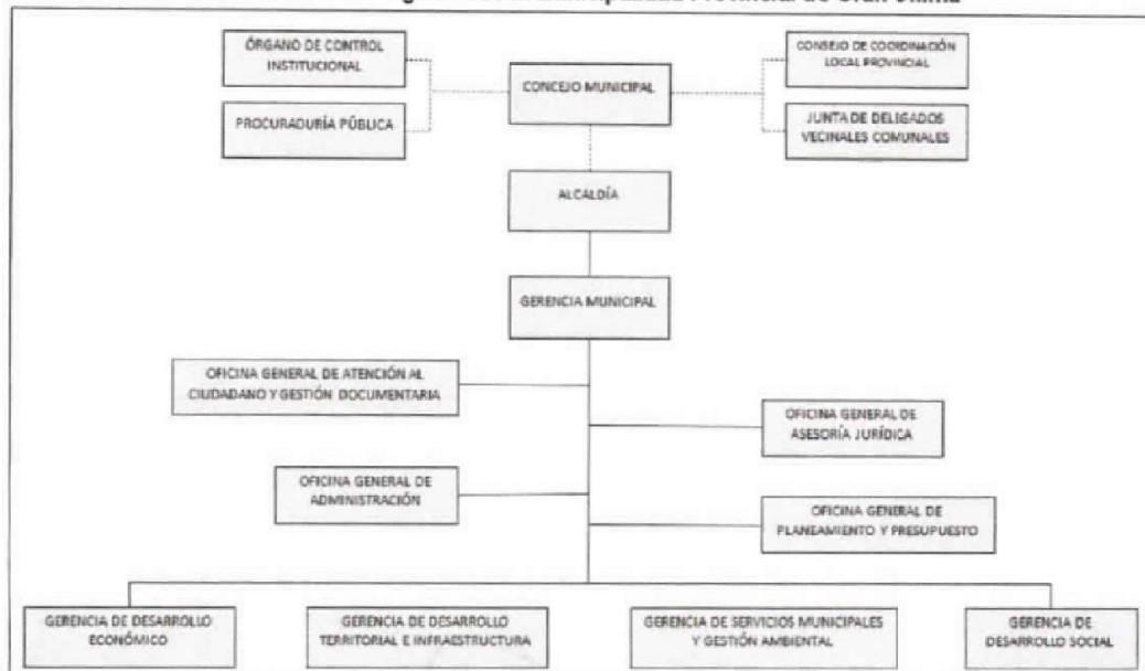
Gráfico n.º 1 Estructura orgánica de la Municipalidad Provincial de Gran Chimú