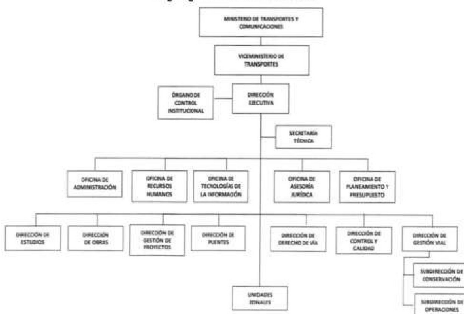
Imagen n.º 2 Organigrama de Provias Nacional