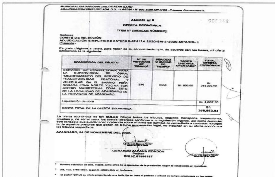
IMAGEN N° 2 ANEXO N° 6 – OFERTA ECONÓMICA, PRESENTADA POR EL POSTOR GERARDO ZAPANA RONDÓN