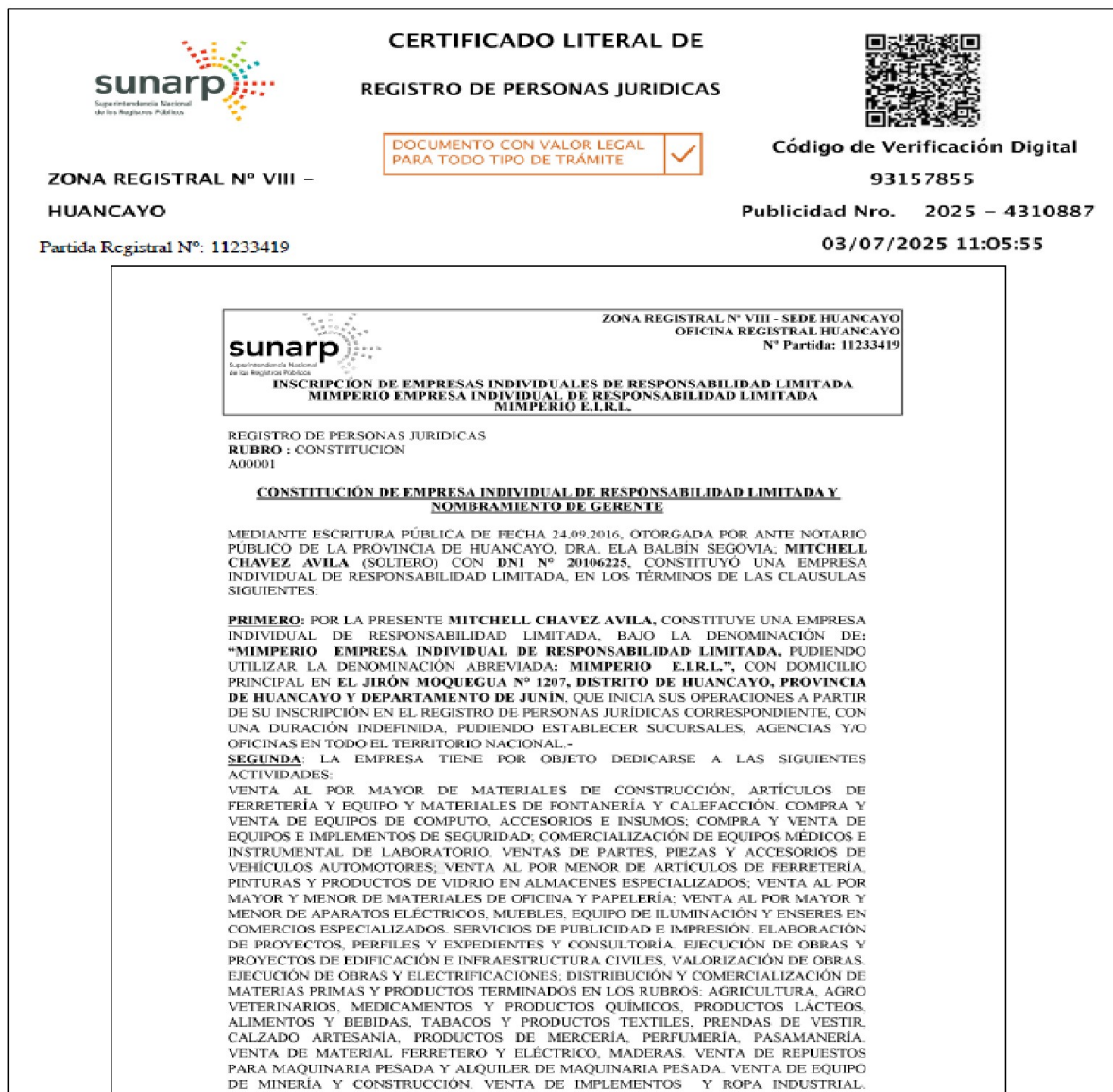
Imagen n.° 4 Partida Registral N° 11233419

Fuente: SUNARP remitido a través del correo electrónico de CGR: cgamboac@contraloria.gob.pe de 3 de julio de 2025. Elaborado por: Comisión de Control