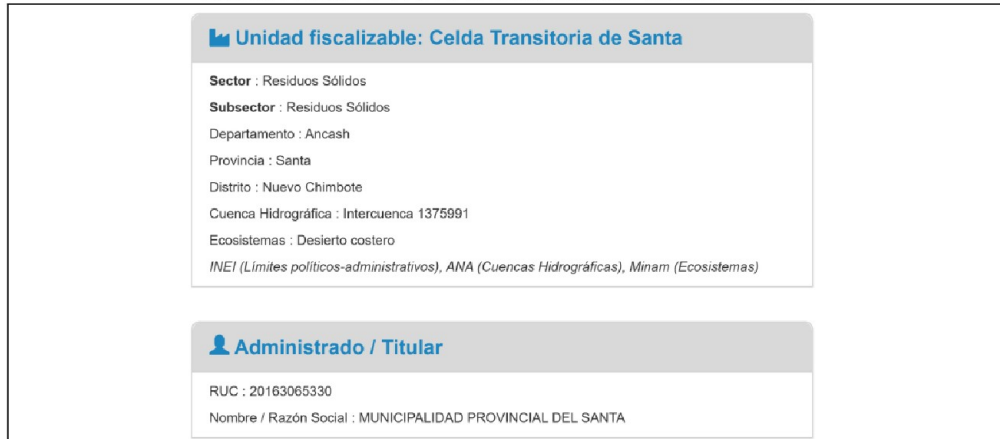
IMAGEN N° 1 UNIDAD FISCALIZABLE: CELDA TRANSITORIA DE SANTA