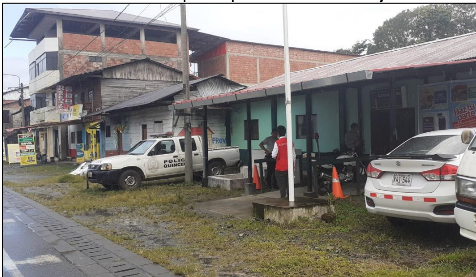
Fotografía n.° 2 Camioneta Inoperativa para el servicio de Patrullaje