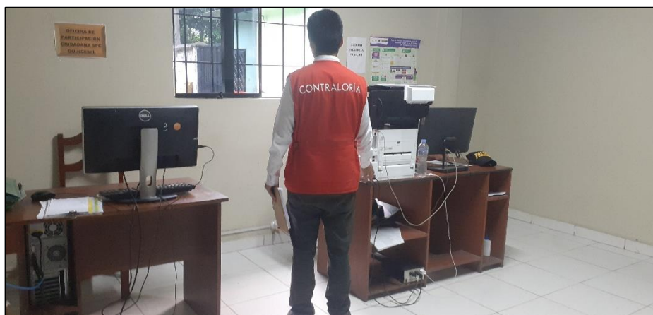
Fotografía n.º 1 Tecnologías de Información y comunicación personal