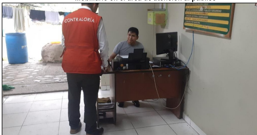
Fotografía n.º 4 Mobiliario en el área de atención al público