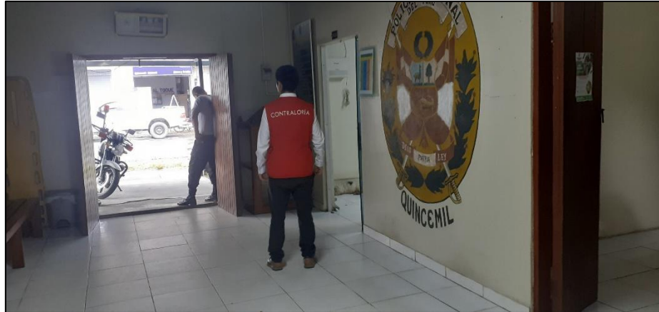
Fotografía n.° 3 Puerta de acceso al área de atención al público