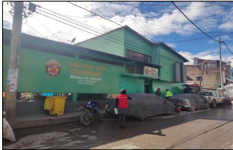
Imagen n.º 4 En la Comisaría no cuenta con área de estacionamiento