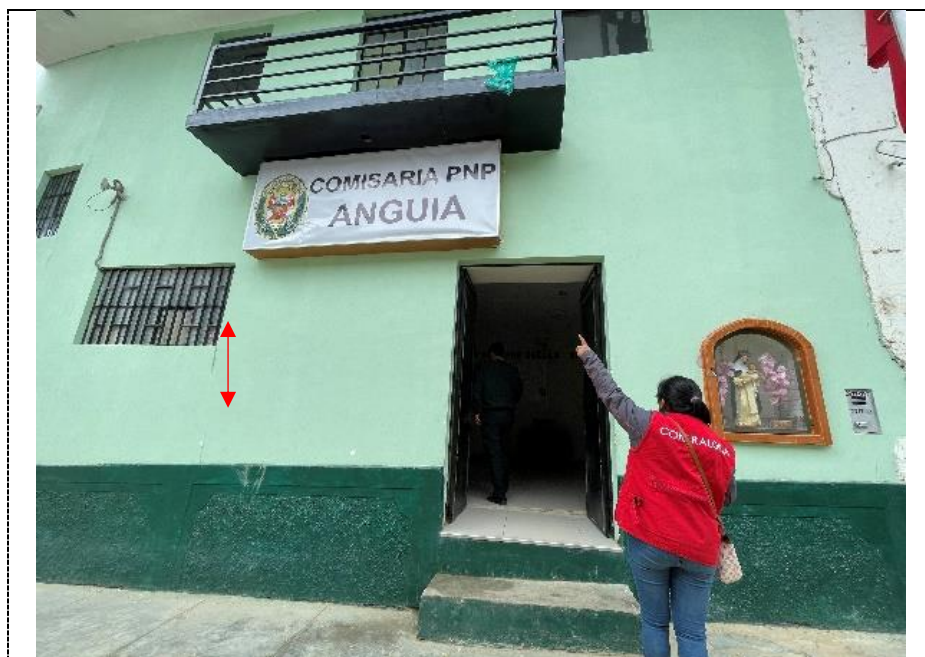
Fotografía N° 1: Vista de la diferencia de niveles desde la acera hasta el ingreso de la edificación de la CPNP Anguía, tomada el 28 de febrero de 2024.