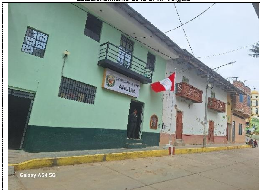
Fotografía N° 8: Vista exterior del estacionamiento de la CPNP Anguía