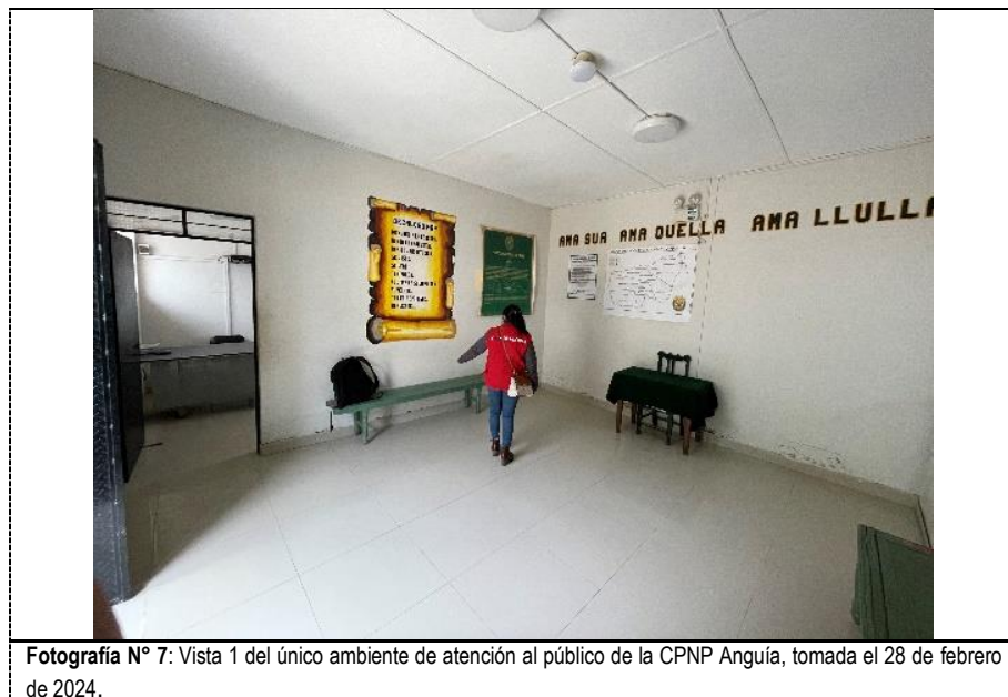
Fotografía N° 7: Vista 1 del único ambiente de atención al público de la CPNP Anguía, tomada el 28 de febrero de 2024.

Al respecto, es de precisar que la falta de señales y avisos que brinden información en las instalaciones de la CPNP Anguía limitaría la orientación de los usuarios, incluidas aquellas personas con discapacidad, situación que puede afectar que se acceda a los servicios policiales, al no contar con la información necesaria para orientarse dentro de las instalaciones; asimismo, vulnera el derecho a la igualdad de acceso y el ejercicio de los derechos ciudadanos en condiciones de igualdad.