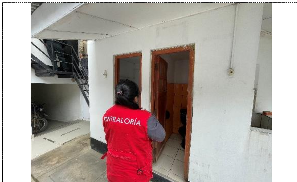
Fotografía N° 4: Vista exterior de los SS. HH. de la CPNP Anguía, tomada el 28 de febrero de 2024.