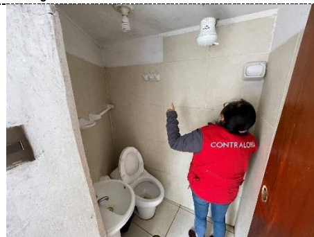
Fotografía N° 6: Vista interior del segundo SS. HH. de la CPNP Anguía, tomada el 28 de febrero de 2024.