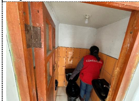
Fotografía N° 5: Vista interior de un SS. HH. de la CPNP Anguía, tomada el 28 de febrero de 2024.