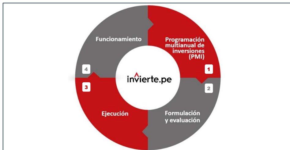
Gráfico n.º 1 Ciclo de Inversión