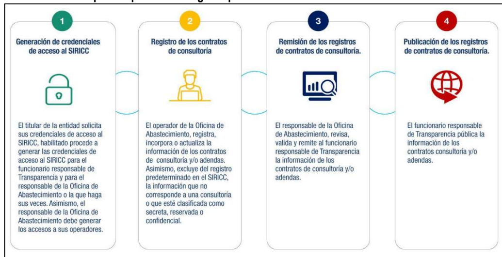
Gráfico n.º 1 Etapas del proceso de registro para el control de contratos de consultoría