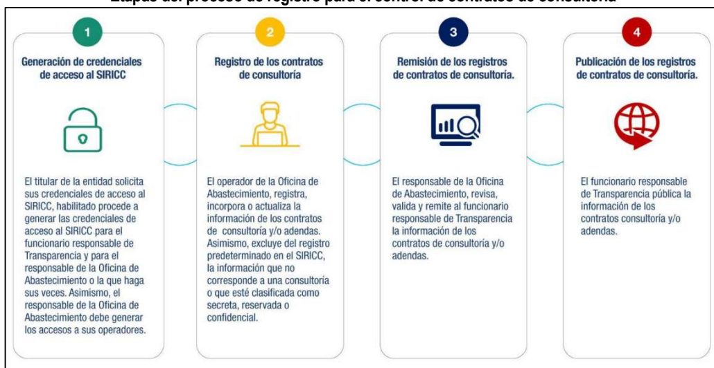
Gráfico n.º 1 Etapas del proceso de registro para el control de contratos de consultoría