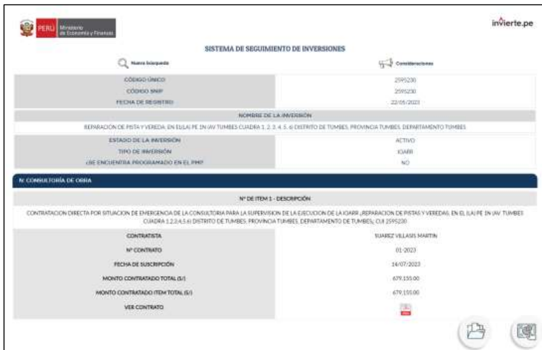
Imagen n.º 8 Datos de los contratos registrados de la Inversión con CUI 2595230