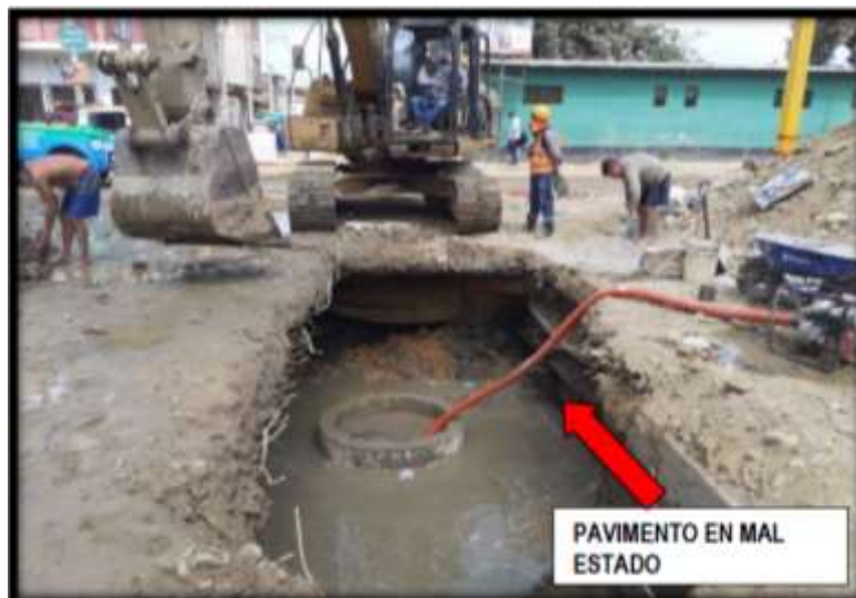
Imagen n.º 3 Estado de Av. Tumbes

Fuente: Formato N° 07-E Registro de IOARR – Estado de emergencia por peligro Inminente u ocurrencia de desastres – Panel Fotográfico, IOARR con CUI 2595230 SUSTENTO DE LA SITUACION ACTUAL DE EMERGENCIA (FOTOS)