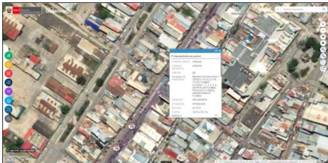
Ubicación de la Inversión con CUI 2595230