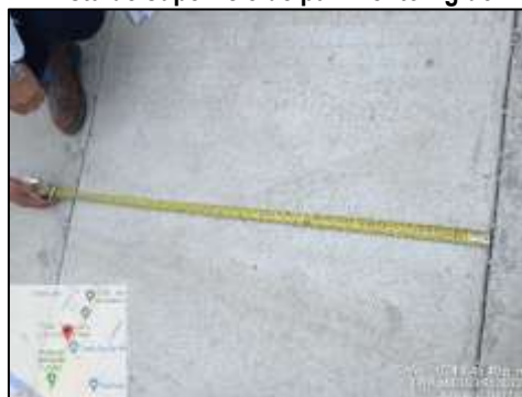
Vista de superficie de pavimento rígido