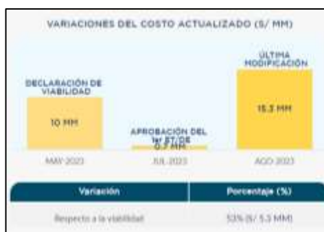
Imagen n.° 4 Variación del Costo Actualizado de la Inversión con CUI 2595230