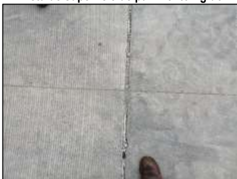
Vista de superficie de pavimento rígido