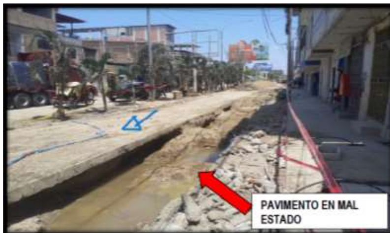
Imagen n.º 2 Estado de Av. Tumbes

Fuente: Formato N° 07-E Registro de IOARR – Estado de emergencia por peligro Inminente u ocurrencia de desastres, IOARR con CUI 2595230 SUSTENTO DE LA SITUACION ACTUAL DE EMERGENCIA (FOTOS)