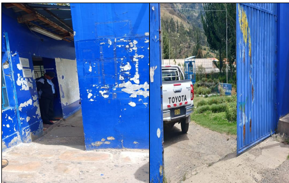
IMAGEN N° 4 DEFICIENCIA DE INFRAESTRUCTURA EN LA PUERTA PRINCIPAL N° 2

Fuente: Formato n.º 1: "Accesibilidad Física para Personas con Discapacidad en Entidades Públicas con OCI" de 9 de abril de 2024.