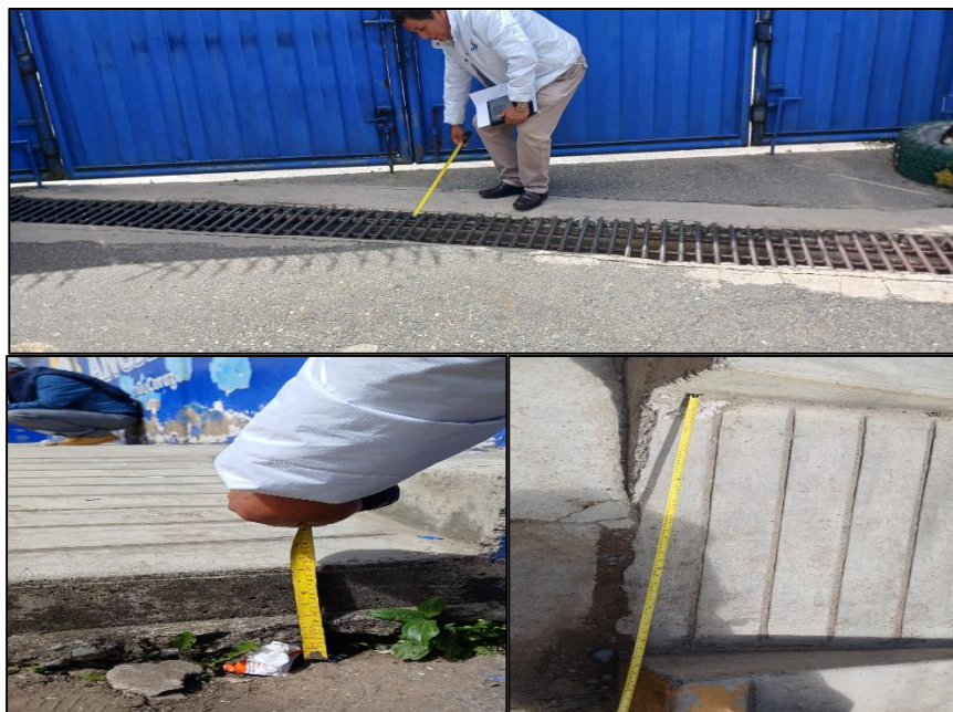
IMAGEN N° 3 CARENCIA DE INFRAESTRUCTURA EN LA PUERTA PRINCIPAL N° 1