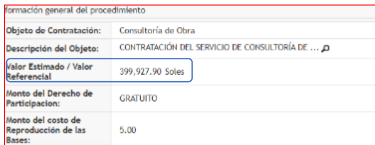
IMAGEN N° 4 INFORMACIÓN GENERAL DEL PROCEDIMIENTO DE SELECCIÓN

en la citada fecha el comité de selección publicó las Bases Integradas con las mismas observaciones detalladas en el "Informe de Acción de Supervisión de Oficio n.° D002453-2022-OSCE", tal como se observa: