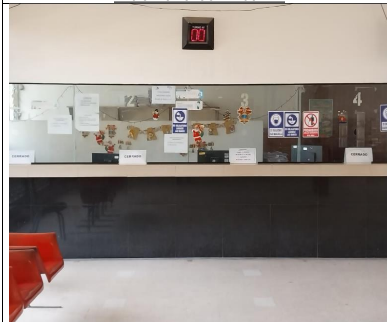
Unidad de Admisión del Hospital Regional de Loreto, se encuentra totalmente vacío y con anuncio bajo la leyenda de CERRADO.