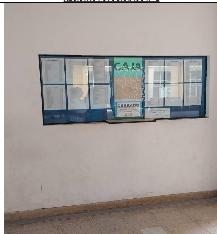
Área de Caja en la Unidad de Admisión se encuentra cerrada.