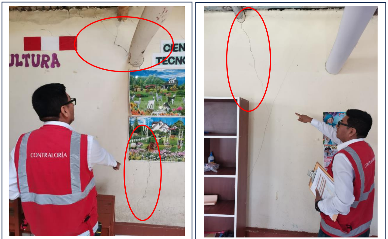
Imágenes n.ºs 1 y 2 Toma fotográfica de las paredes de las aulas, donde se muestran fisuras y grietas.