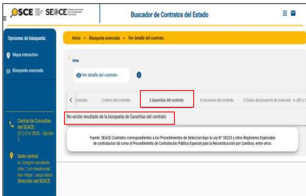
IMAGEN N° 12 Búsqueda de Garantías del Contrato por proceso n.° 26-2023-GA/MDU