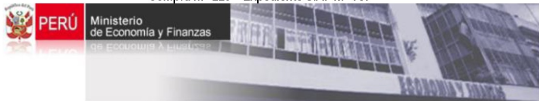
Imagen n.º 2 Consulta expediente administrativo – Orden de Compra n.º 226 – Expediente SIAF n.º 787

Cabe precisar, con relación a la experiencia del postor por S/ 6 744,90, la Comisión de control, realizó la consulta de los expedientes administrativos a través del portal del Ministerio de Economía y Finanzas (MEF), que se encuentran vinculadas con las órdenes de compra n.ºs 226 por S/ 2 142,50 y 262 por S/ 1 548,40, que corresponden a los expedientes SIAF n.ºs 787 y 983; respectivamente, advirtiéndose que la primera de éstas, no se encuentra pagada hasta la fecha, dado que, se encuentra en la fase de compromiso del gasto, y el segundo, con relación a su ejecución del gasto, fue aprobado la fase del girado el 11 de octubre de 2024, es decir, 8 días después del otorgamiento de la buena pro, conforme se muestran en las imágenes de las consultas efectuadas en línea a través del MEF: