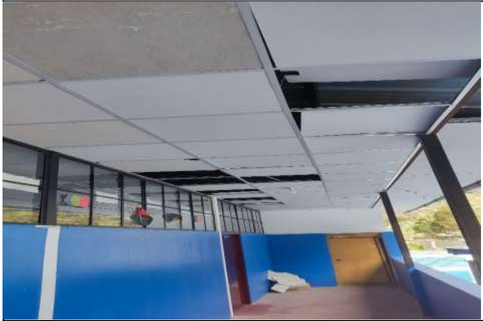
Imagen n.º 03 Aulas con techo de cielorraso suspendido con falta de mantenimiento y filtraciones de agua entre las juntas del techo de estructura metálica.