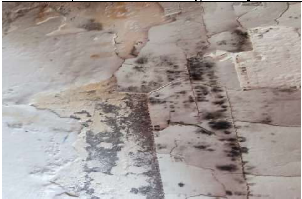
Imagen n.º 04 Junta de paredes con filtraciones de humedad y presencia hongos.