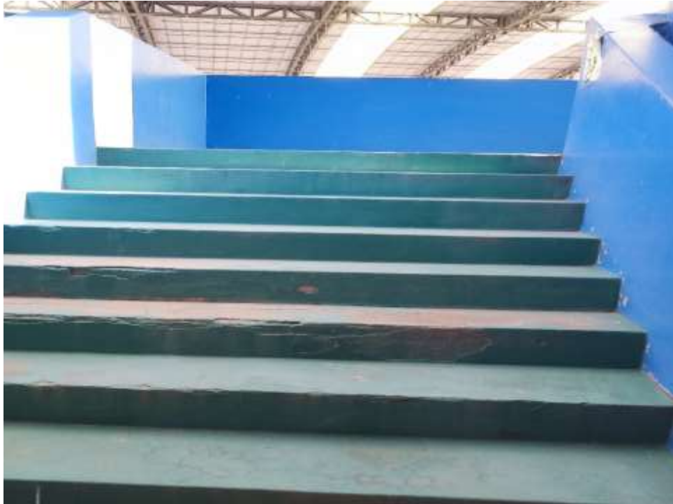
Imagen n.º 05 Escaleras no cuentan con barandas en los pabellones del sector secundario y primario, asimismo se encuentran resquebrajadas lo cual podría generar accidentes.