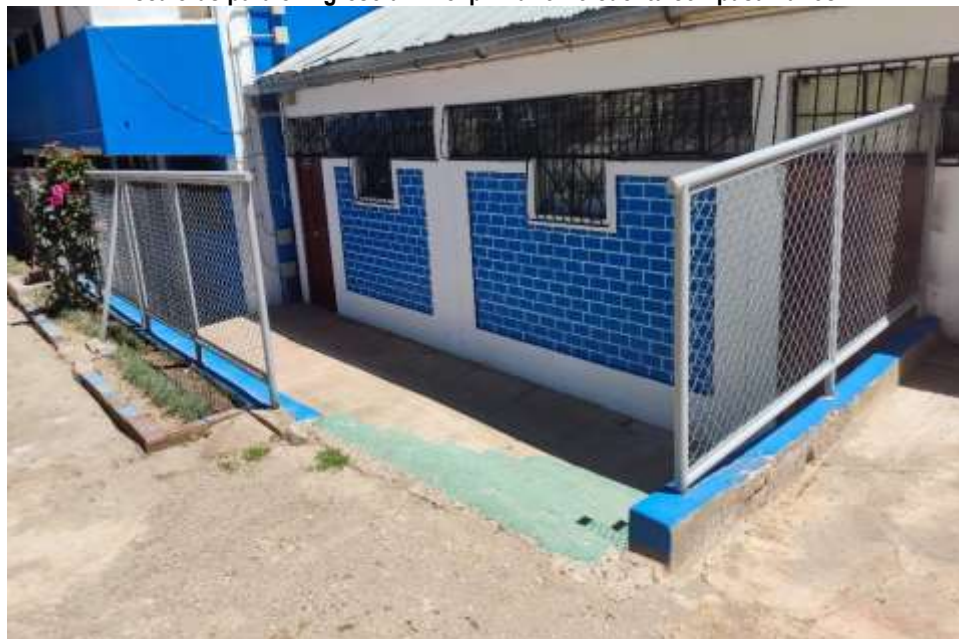
Imagen n.º 06 Escaleras para el ingreso al nivel primario no cuenta con pasamanos.