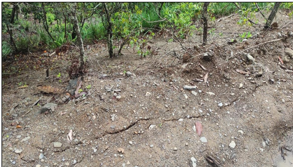
IMAGEN N° 2 FISURAS UBICADAS EN LA PLATAFORMA DE LA LÍNEA DE CONDUCCIÓN ENTRE LAS PROGRESIVAS 0+430 A 0+460