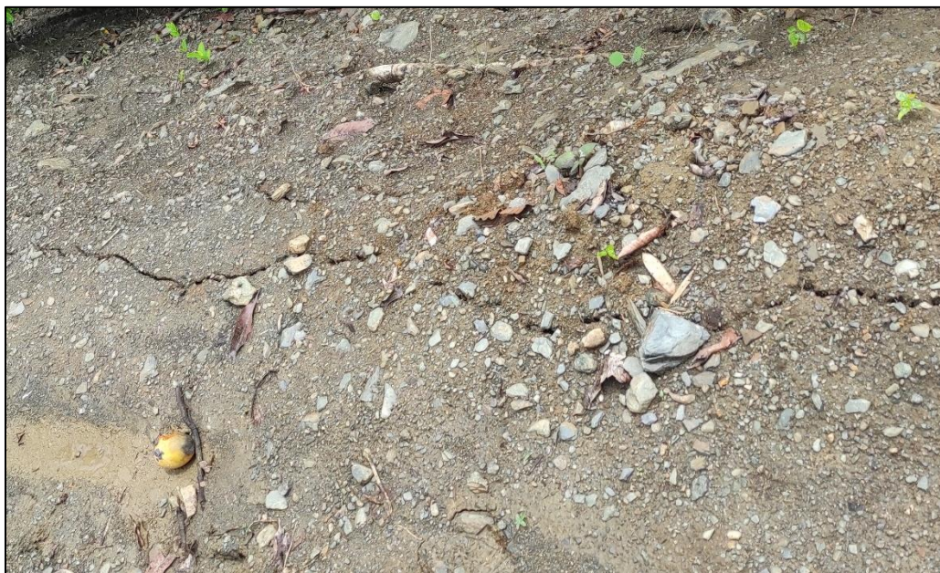
IMAGEN N° 1 FISURAS UBICADAS EN LA PLATAFORMA DE LA LÍNEA DE CONDUCCIÓN ENTRE LAS PROGRESIVAS 0+550 A 0+560