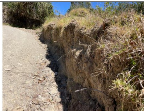
Imagen n.º 18: Se observa talud con pendiente nula en la progresiva 0+080.