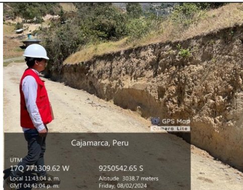
Imagen n.º 22: Se observa terreno inestable con posible riesgo de deslizamiento en la progresiva 0+300.

Fuente: Acta de inspección física n.º 03-2024-MPH/OCI-SCC-NSJB de 2 de agosto de 2024.