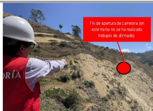
Imagen n.º 3: Se observa que hasta este punto ha llegado la apertura de la carretera, que no se pudo culminar producto de deslizamientos.

Asimismo, tal como se pudo observar en la visita realizada, la apertura de la carretera para la vía vecinal se ejecutó hasta un cierto punto y a una altura considerable con respecto a la carretera que va hacia La Llica, esto según se observa en las siguientes imágenes: