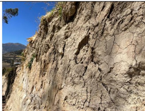
Imagen n.º 21: Se observa terreno inestable con posible riesgo de deslizamiento en la progresiva 0+800.