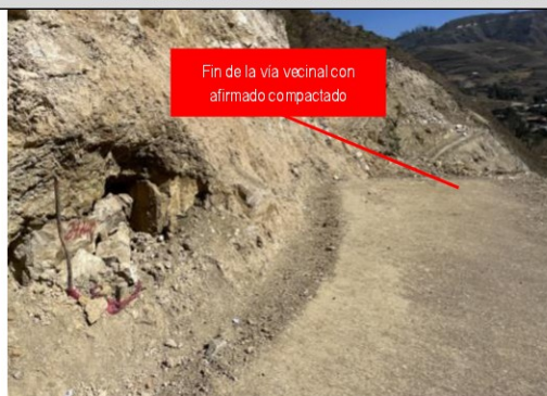
Imagen n.º 1: Tramo final de la vía vecinal construido y con afirmado compactado (progresiva 2+750km).

Ahora bien, teniendo en cuenta la conformidad otorgada respecto a la culminación y recepción de la Obra, la comisión de control se apersonó al lugar de la misma, el día 2 de agosto de 2024, según consta en acta de inspección física n.º 03-2024-MPH/OCI-SCC-NSJB, advirtiéndose que la vía vecinal (con afirmado) ha sido ejecutada desde la progresiva 0+000km hasta la progresiva 2+750 km, puesto que, de allí en adelante se han producido grandes deslizamientos y derrumbes de terreno que han afectado a los últimos metros de la carretera, tal como se puede apreciar en las siguiente imágenes: