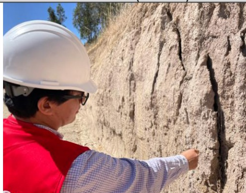
Imagen n.º 20: Se observa terreno inestable con posible riesgo de deslizamiento entre las progresivas 1+810 y 1+830.