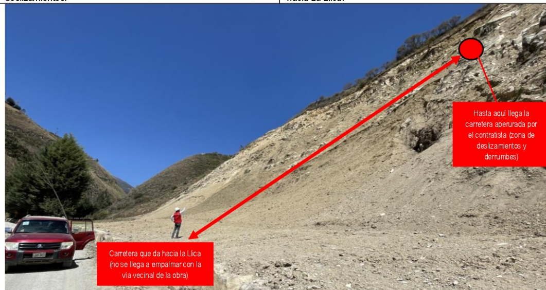
Imagen n.º 5: Se observa carretera a La Llica y en la parte alta el punto hasta donde se llegó a aperturar la carretera de la Obra (zona de deslizamientos y derrumbes).