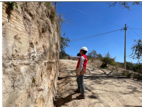
Imagen n.º 17: Se observa talud con pendiente de inclinación mínima, en la progresiva 1+160.