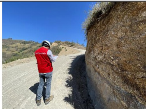
Imagen n.º 15: Se observa talud con pendiente mínima de inclinación (casi nula) en la progresiva 1+500.