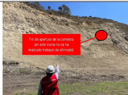
Imagen n.º 4: Se observa el punto donde ha llegado la apertura de la carretera, la cual no llega a empalmar con la carretera que da hacia La Llica.