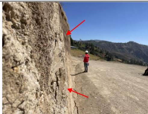
Imagen n.º 19: Se observa talud con pendiente nula y terreno inestable con posible riesgo de derrumbe en la progresiva 0+080.

En ese sentido, los taludes se deberán construir con la finalidad de determinar las condiciones de su estabilidad de forma prioritaria en zonas que presenten fallas geológicas o materiales inestables; no obstante, en la visita realizada se ha podido evidenciar que algunos de los taludes observados presentan grietas y fisuras, lo que indicaría la presencia de material inestable con probabilidad de desprendimiento, tal como se muestra en las imágenes siguientes: