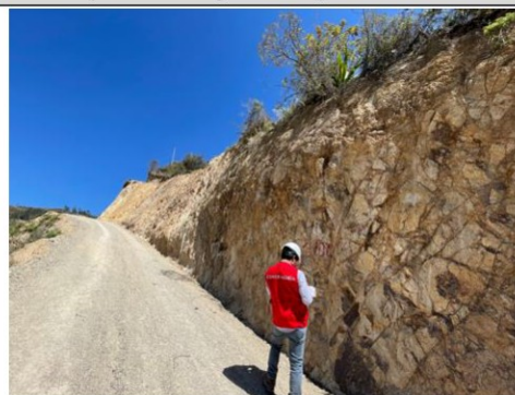
Imagen n.º 16: Se observa talud con pendiente de inclinación mínima, en la progresiva 1+280.