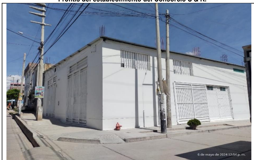
Imagen n.º 1 Frontis del establecimiento del Consortio S & R.