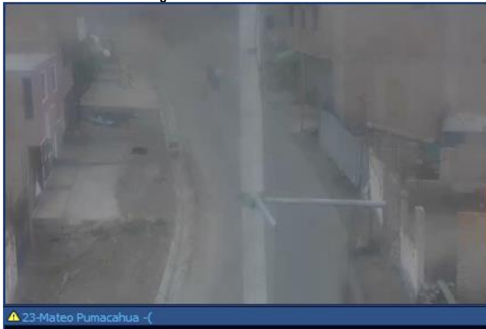
Imagen n.º 3 Cámara de videovigilancia sin nitidez ubicada en Mateo Pumacahua