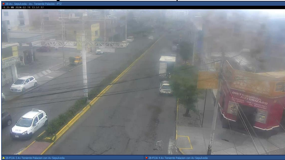
Imagen n.º 2 Cámara de videovigilancia sin nitidez ubicada en Av. Sepúlveda – Av Teniente Palacios-PTZ

Fuente: Central de Monitoreo de Cámaras de videovigilancia de la Gerencia de Seguridad Ciudadana de la Municipalidad Distrital de Miraflores 19 de febrero de 2024