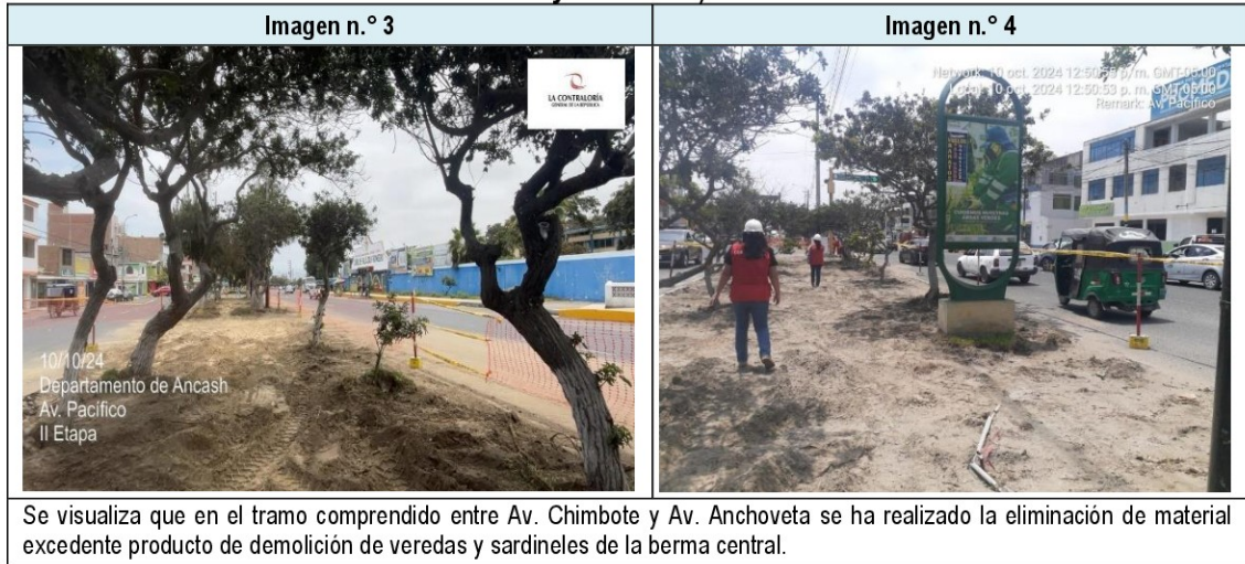
Imagen n.º 3 y 4 Tramos con eliminación de material de demolición realizado en Av. Pacífico (entre Av. Pelicanos y Av. Central)

Además, de la revisión al cuaderno de obra digital, se verificó que en los asientos n.º 4 de 3 de octubre 2024, n.ºs 15, 16 y 17 de 10 de octubre 2024, n.º 19 de 11 de octubre 2024, n.º 29 de 15 de octubre 2024 y n.º 30 de 16 de octubre 2024, se registró la realización de los trabajos correspondiente a la eliminación de material excedente. Es decir, desde el inicio de la obra hasta el 16 de octubre de 2024, la empresa Contratista habría efectuado la eliminación del material proveniente de las demoliciones de las estructuras de la berma central y de otros trabajos.