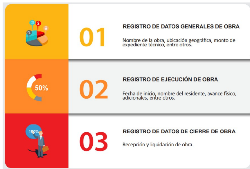
IMAGEN N° 1 PROCESO DE REGISTRO EN EL INFOBRAS