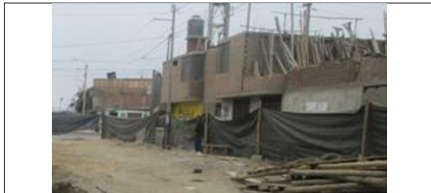
FOTOGRAFÍA N° 4 SEÑALIZACIÓN TEMPORAL DE SEGURIDAD

Descripción: Se visualiza el cerco temporal de seguridad (tipo costal) que no garantiza la seguridad de las personas, así mismo no se encontró personal que custodie el ingreso.